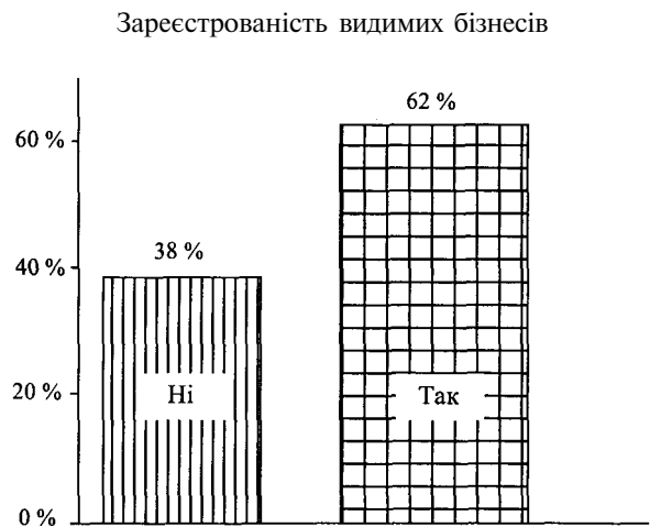
Графік № 1. Чи зареєстрований ваш бізнес?

Серед видимих підприємницьких одиниць частка тих, хто не є офіційно зареєстрованими, становить 38 % від загального числа опитаних (див. графік № 1).