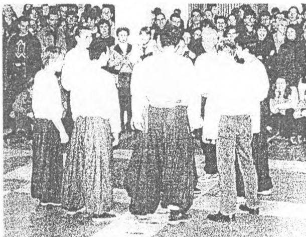
Під час показового виступу

Спас був невід'ємною частиною життя людини, що часто перебувала в низових заплавах Дністра, Південного Бугу та Дніпра. Жити у багатих, але небезпечних плавнях та лісах Надчорномор'я, означало постійно наражатись на можливість сутичок із кочовиками, воїнами ворожих держав, небезпечними людьми будь-якого гатунку тощо. Часи формування Київської Русі й подальші події не залишили ліси Надчорномор'я безлюдними - це були улюблені місця волхвів, мандрівних вільних воїнів Надчорномор'я (так званих «бродників», «берладників»), які інколи брали участь у походах дружин князівств Київської Русі, допомагали в боротьбі проти степових кочовиків. Спас сформувався як стиль бою незброєного чи малоозброєного, його рухи схожі на своєрідний «танець з супротивником» - проте, дуже короткий за тривалістю. Рухи розслаблено-пружні, постійний гойдок, входження в ритм