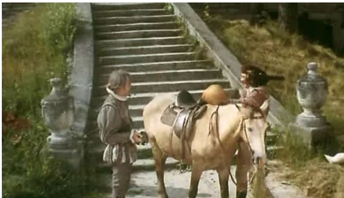
Кадр із фільму “Д'Артаньян і три мушкетери”(1979). Свірзький замок