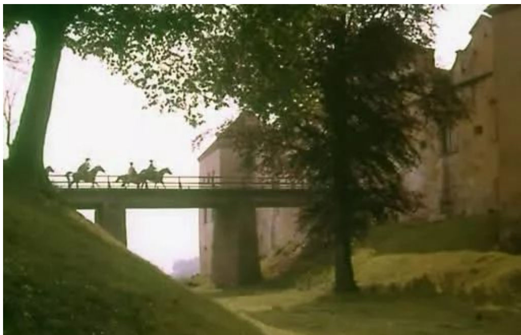
Кадр із фільму “Д'Артаньян і три мушкетери”(1979). Свірзький замок