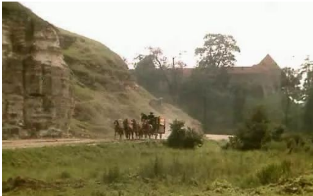
Кадр із фільму “Д'Артаньян і три мушкетери”(1979). Свірзький замок