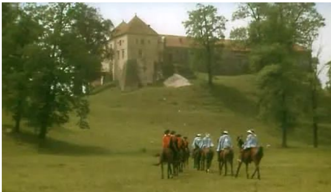
Кадр із фільму “Д'Артаньян і три мушкетери”(1979). Свірзький замок