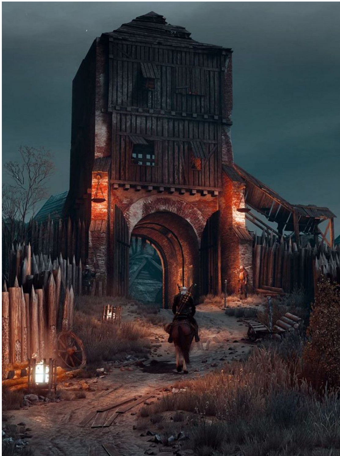
Луцький замок у комп'ютерній грі "Відьмак" [46].