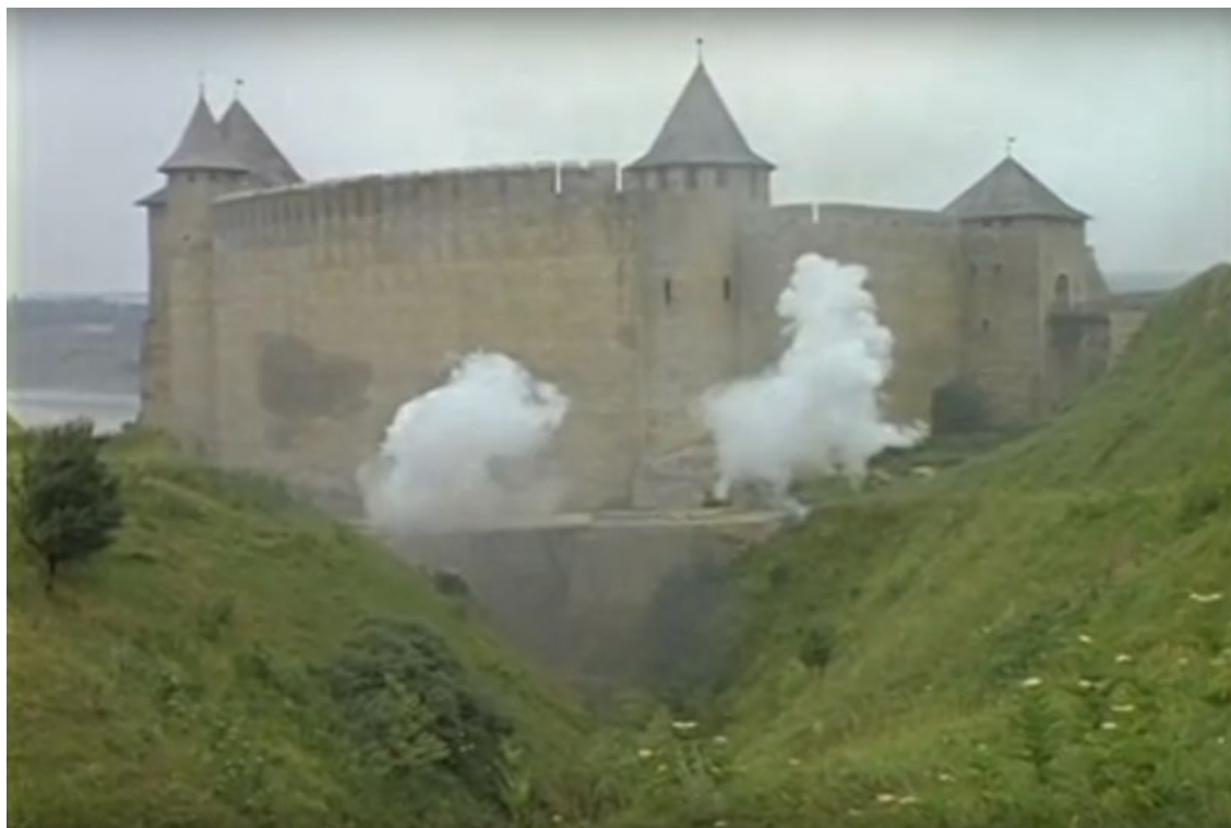
Кадр із фільму “Д'Артаньян і три мушкетери”(1979). Хотинська фортеця