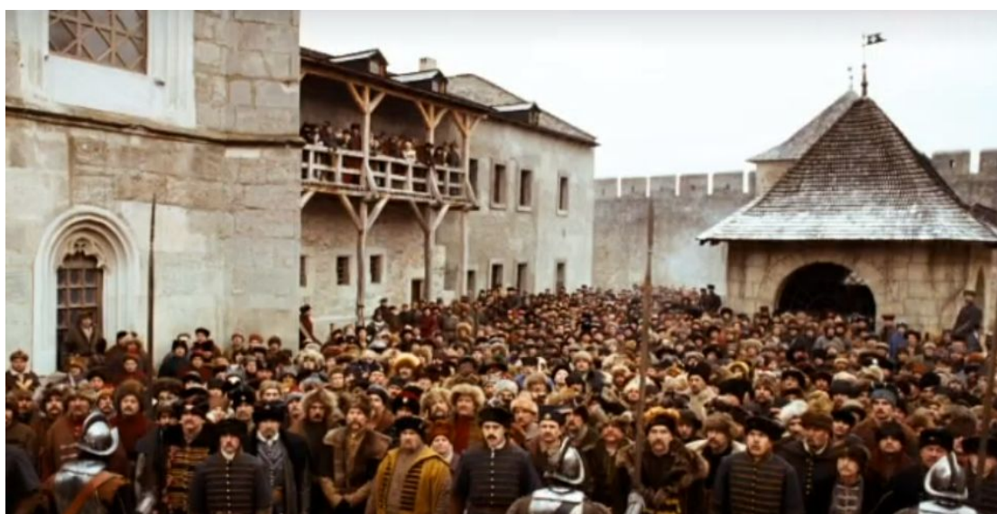
Кадр із фільму “Тарас Бульба”(2009). Хотинська фортеця