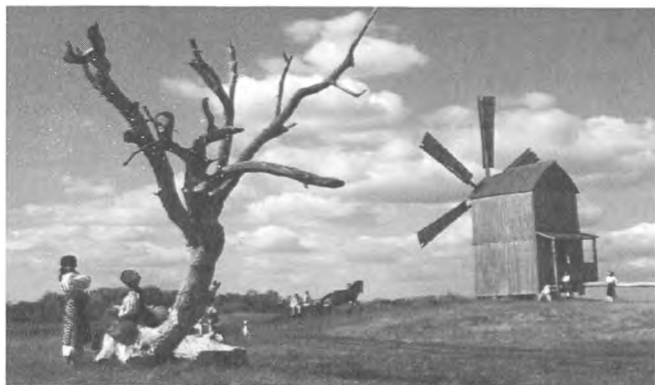
Кадр з фільму «Чорний козак».