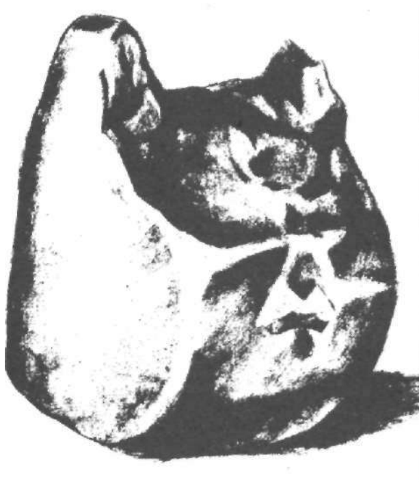
Рис. 3. Неолітичне зображення голови бика