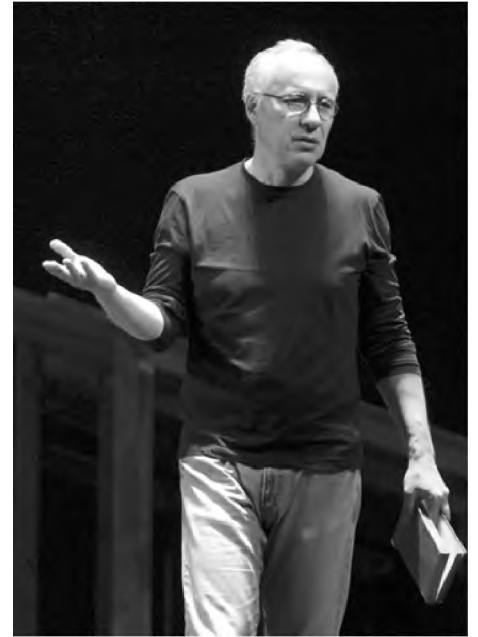
Режисер театру і кіно Сергій Маслобойщиков.