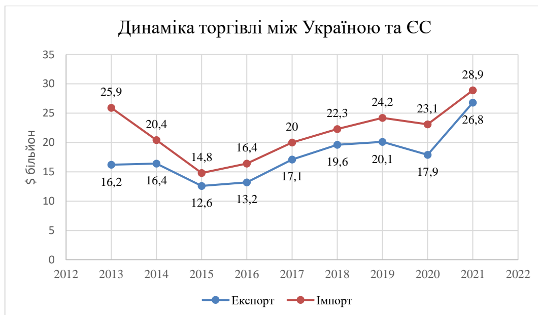
Рисунок 2.1. Динаміка торгівлі між Україною та ЄС

Аналізуючи українську економіку, чітко простежується, що вона тісно пов'язана з економікою інших країн, особливо з країнами Європейського Союзу. Обсяг міжнародної торгівлі з кожним роком зростає (рис. 2.1).