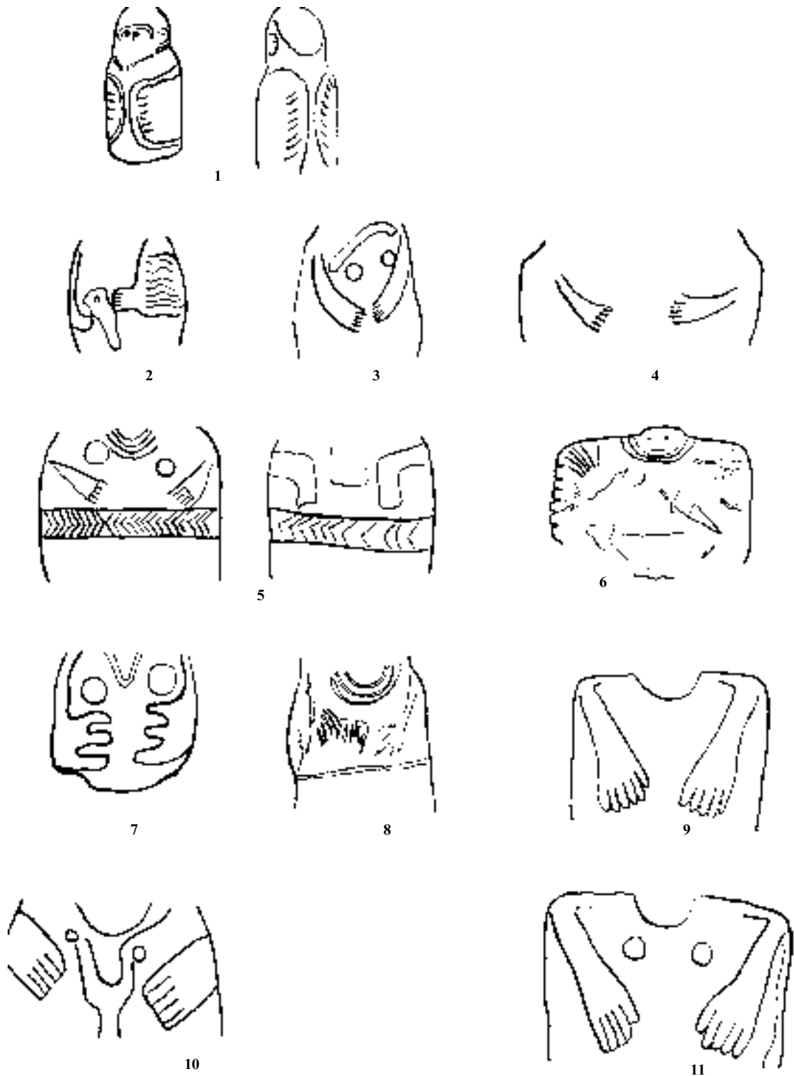
Табл. III. Зображення верхніх кінцівок на статуарних пам'ятках Південно-Західної Європи та Надчорноморщини