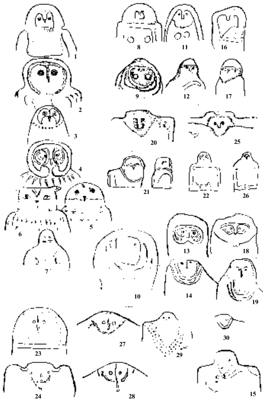
Табл. I. Статуарні пам'ятки з орніто-антропоморфними рисами