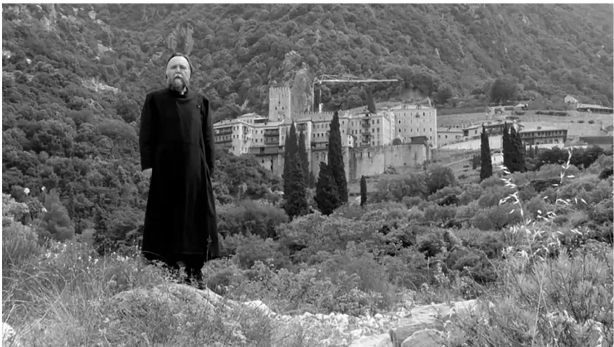
Ідеологія сучасного «рашизму», на думку більшості дослідників, формувалася за участі низки російських інтелектуалів і публіцистів