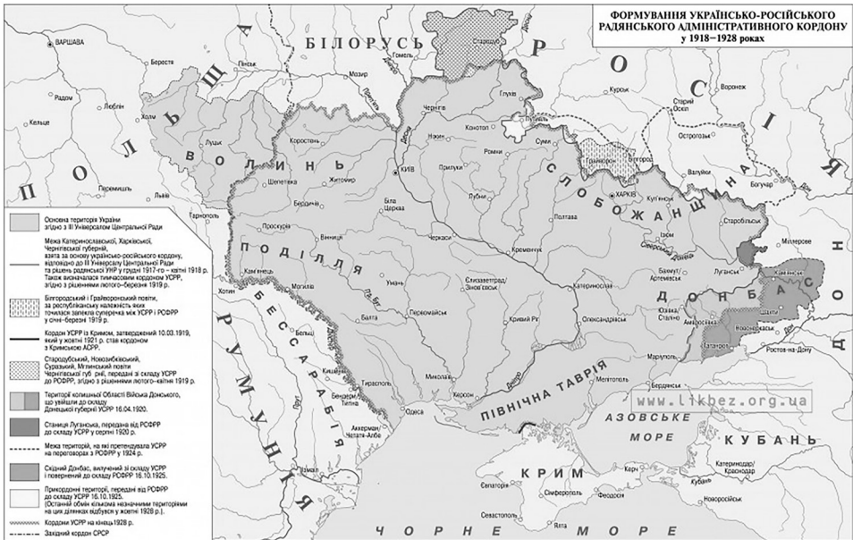
Формування українсько-російського радянського адміністративного кордону (1918–1928)

В нинішній спершу гібридній, а далі відверто тотальній війні (знищення цивільної інфраструктури) проти України Росія скинула будь-яке маскуваннн сфальсифікованими під тиском зброї блонзірськими «волевиявленнями». Вона зазнала поразки своїх спроб загартати Україну, гальванізувати труп імперії та показати агресію, буцімто як «оборону» окупованих і нашвидкуруч приєднаних теренів. Держава-агресор довела нездатність до самостійного існування і без будь-яких виправдань марно закликала Польщу, Румунію і Угорщину взяти участь у зухвалому поділі України, на що ці держави звичайно не погодились. А обстрілами мирних міст Росія остаточно заставувала себе ганьбою і дала підстави для дедалі ширшого міжнародного визнання її спонсором тероризму.