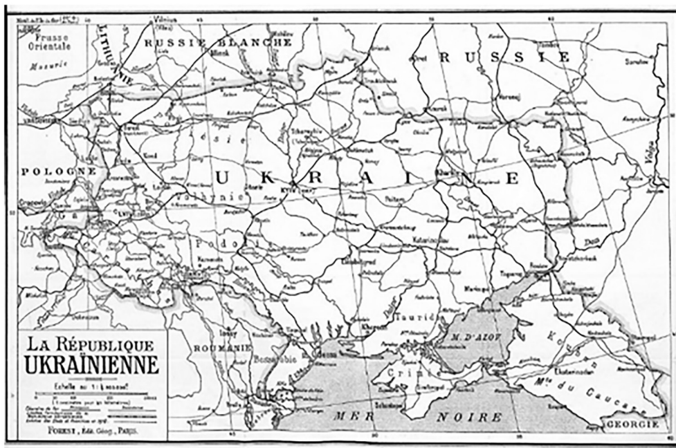
Карта для Паризької мирної конференції 1919 р.