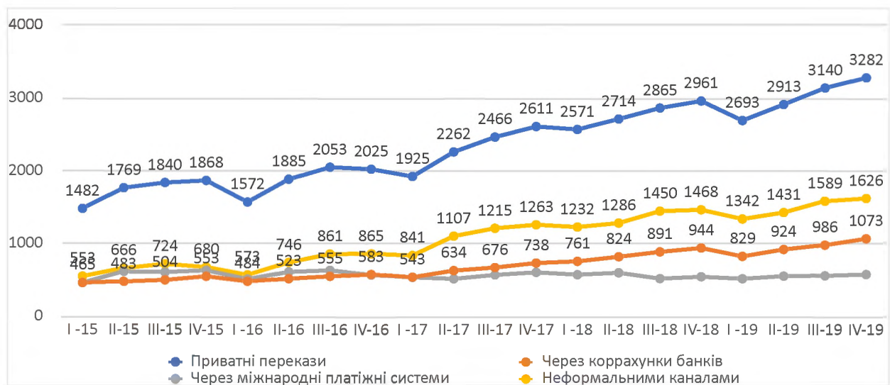
Рис. 1. Приватні перекази в Україну (динаміка і способи переказу), млн. дол. США [2]

Грошові перекази в країнах, що розвиваються, часто вважаються одним з основних джерел зовнішнього фінансування. Україна не є винятком - за останні десять років приплив грошових переказів від українських мігрантів збільшився у кілька разів. З рисунку 1 можна побачити, що тільки за останні 4 роки їхній об'єм збільшився вдвічі, а половина цих переказів здійснюється через неформальні канали. Це означає, що міграція стає все більш популярною в Україні, а більшість мігрантів працюють нелегально і використовують неформальні канали передачі переказів.