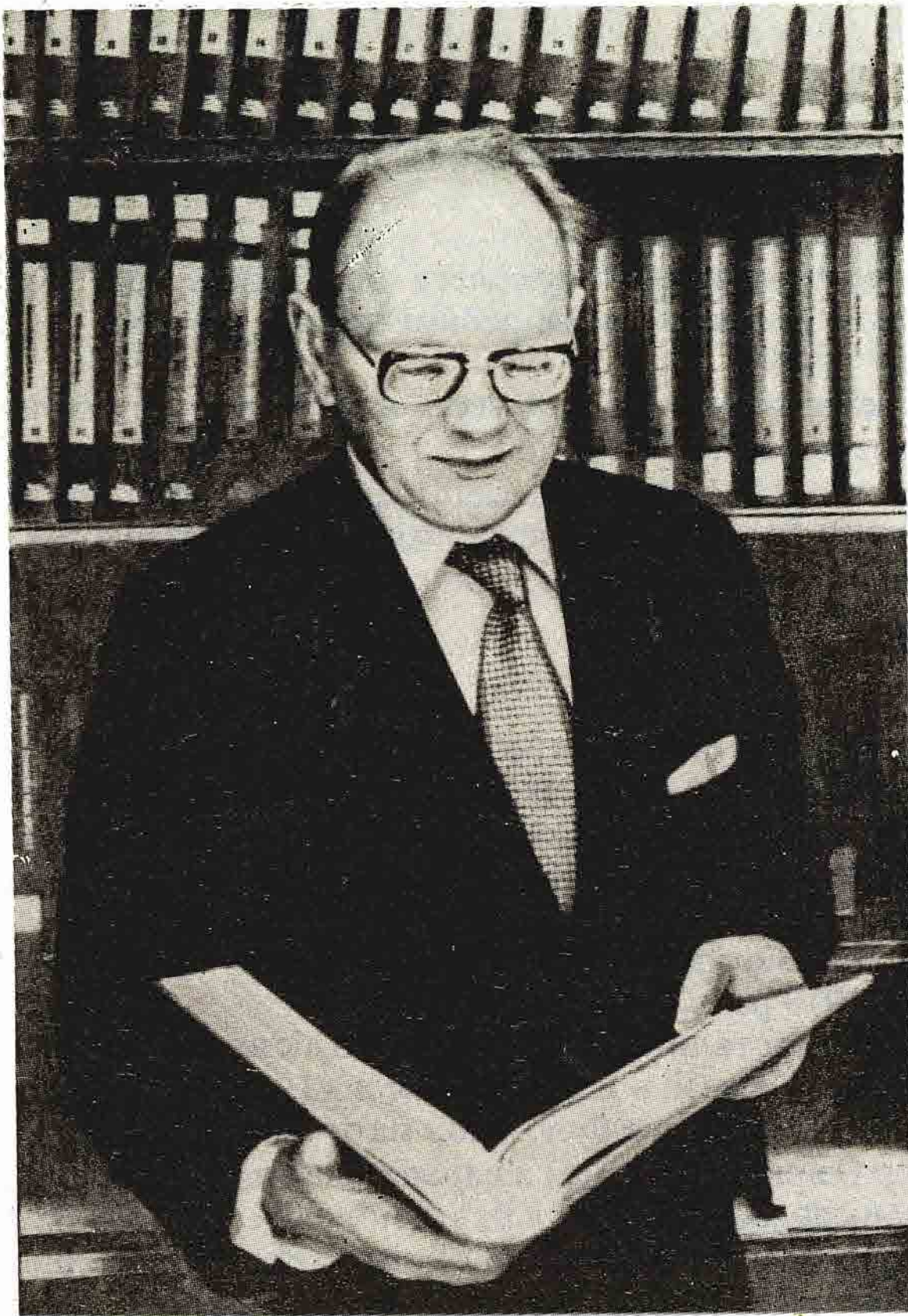
August 1980.