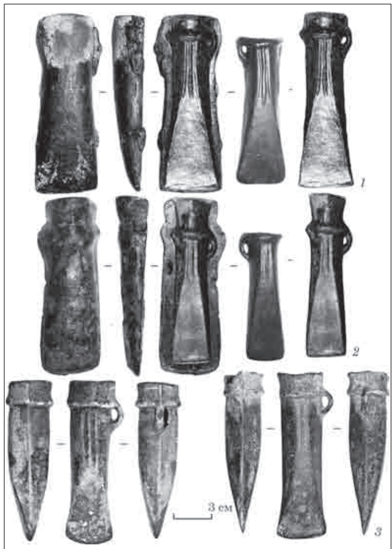
Рис. 3. Ливарна форма з с. Жерденівка Гайсинського р-ну Вінницької обл. (1); ливарна форма з с. Писарівка Старокостянтинівського р-ну Хмельницької обл. (2); скарб з Полтавської обл. (3)

З пізнім етапом чорноліської культури пов'язують кельти «чорноліські»