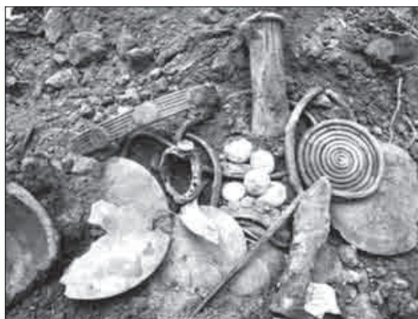
Рис. 1. Шаргородський скарб на місці знахідки

Шаргородську знахідку доповнюють половинки бронзових ливарних форм для виготовлення кельтів лужицького типу з с. Жерденівка Гайсинського р-ну Вінницької обл. (рис. 3, 1) та с. Писарівка Старокостянтинівського р-ну Хмельницької обл. (рис. 3, 2). Вони свідчать про те, що лужицькі кельти не завозили туди зда-