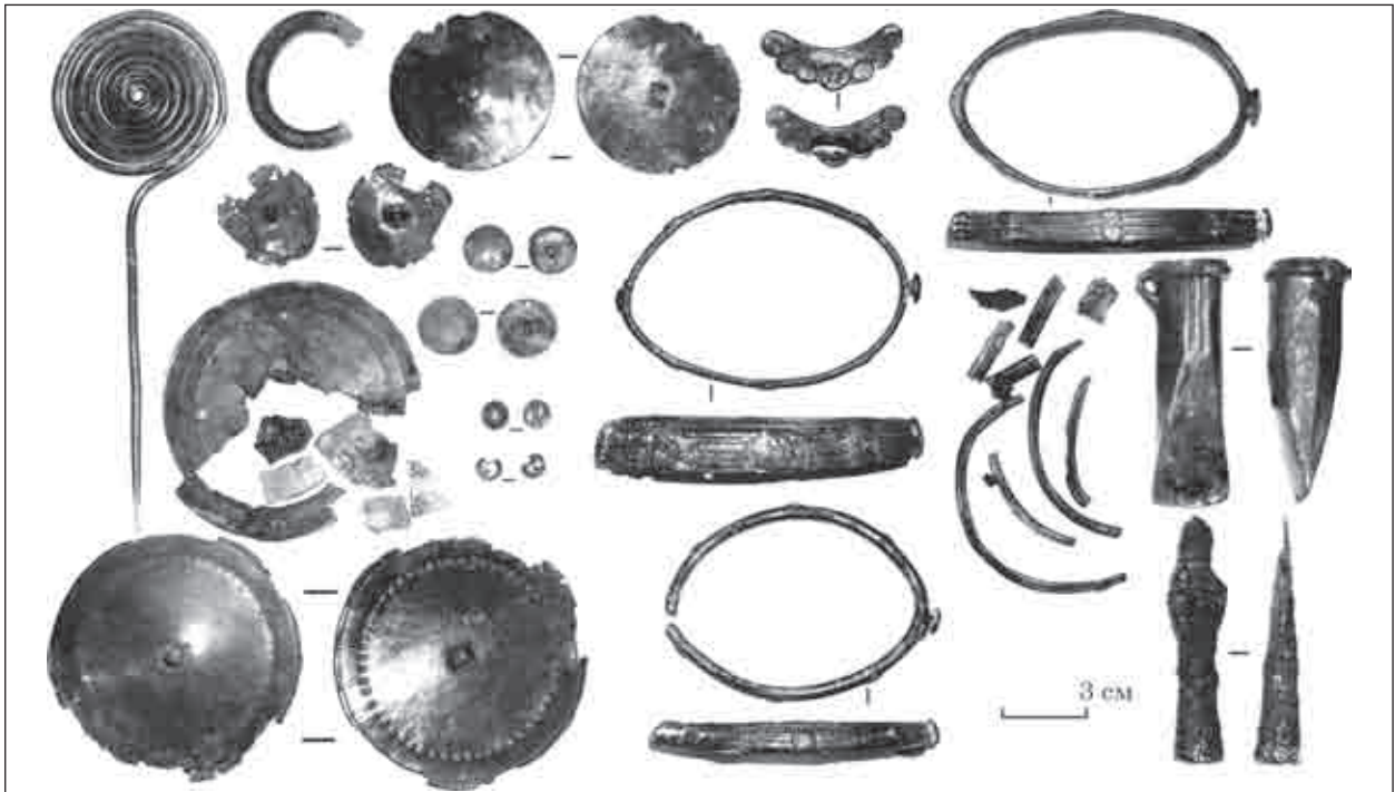
Рис. 2. Шаргородський скарб

леку, а виготовляли на місці, зокрема на Поділлі, очевидно з місцевої сировини, виплавленої з дністровських мідяних пісковиків [Kloczko, Manichev, Kompanec, Kovalchuk, 2003].