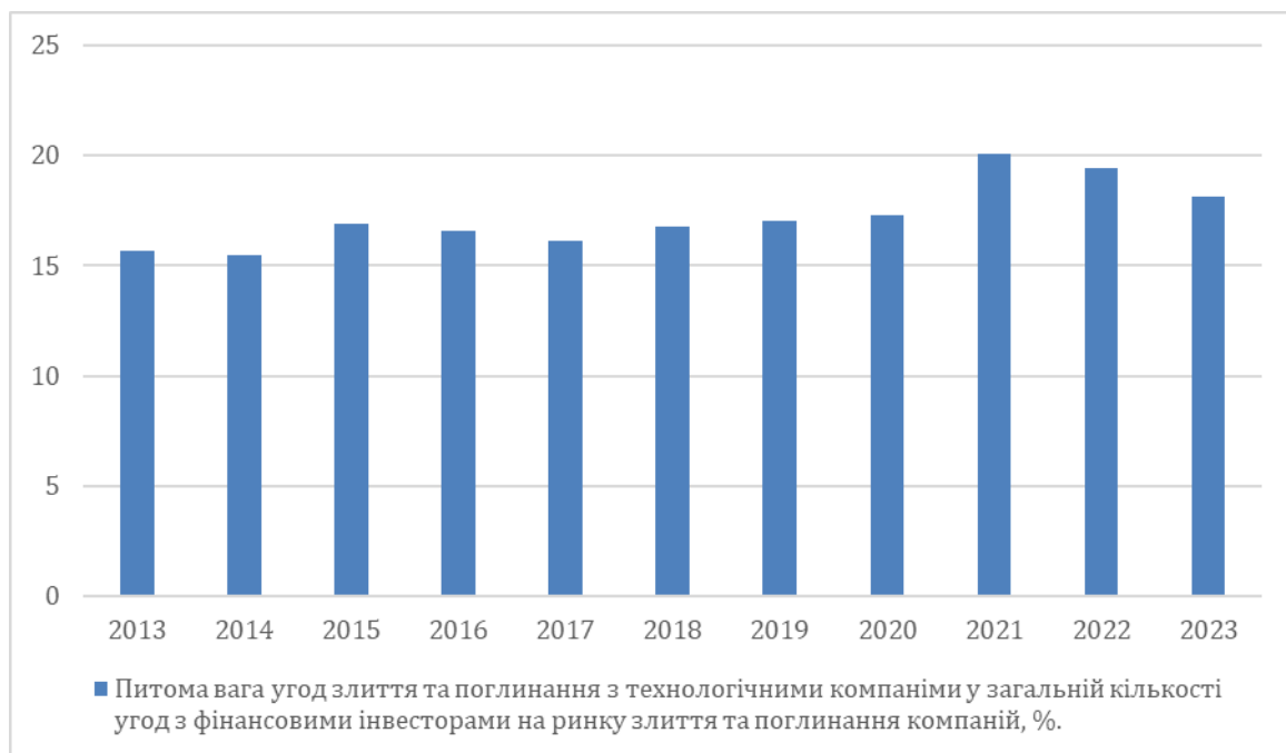
Рис. 2. Питома вага угод злиття та поглинання з технологічними компаніями у загальній кількості угод з фінансовими інвесторами на ринку злиття та поглинання

Аналіз угод на ринку злиття та поглинання (M&A targets) показав, що у 2023 р. відбулось значне зниження операцій злиття та поглинання, здійснених фінансовими інвесторами, і за прогнозами вчених, кількість таких операцій зменшиться [18]. У середньостроковій перспективі розвитку ринку злиття та поглинання компаній у світовій економіці переважають операції, в яких цифровізація компаній, включаючи генеративний штучний інтелект і робототехніку, придбання, які зосереджені на технологічних рішеннях і можливостях, залишається основним рушієм для укладання угод. Аналіз динаміки угод з технологічними компаніями за останні 10 років, показує загальну тенденцію до зростання кількості таких угод на ринку злиття і поглинання компаній (рис. 2).