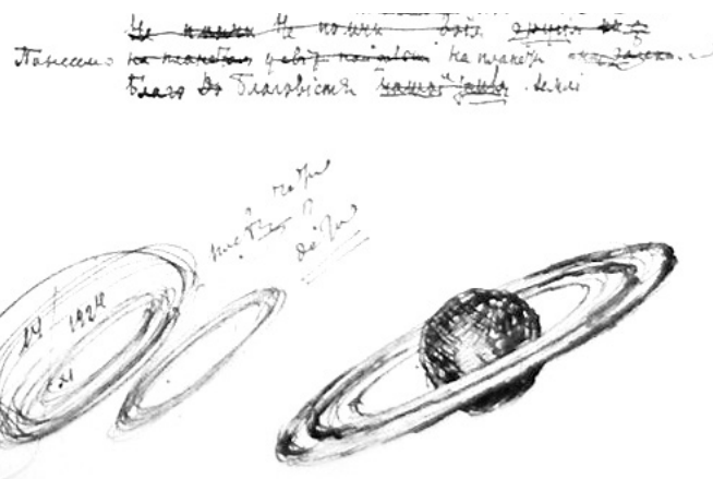
Рис. 1. Малюнок планети Сатурн, виконаний М. Зеровим [13, арк. 10]