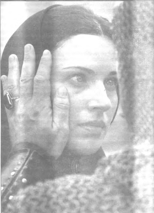
■ Кадр з фільму «Богдан Зіновій Хмельницький».

ніколи не оспівували клановості, не пропагували сексу у відвертому, вульгарному вигляді, який нині заповонив усі телеканали і кінотеатри. Проте все це наносне й чуже нам, я сподіваюся, воно з часом щезне, мов весняні води. А ще вірю, що відродиться наше кіно, бо неминуче будуть нові закони, які дадуть змогу дихнути свіжим повітрям не тільки митцям, а й фінансистам, меценатам.