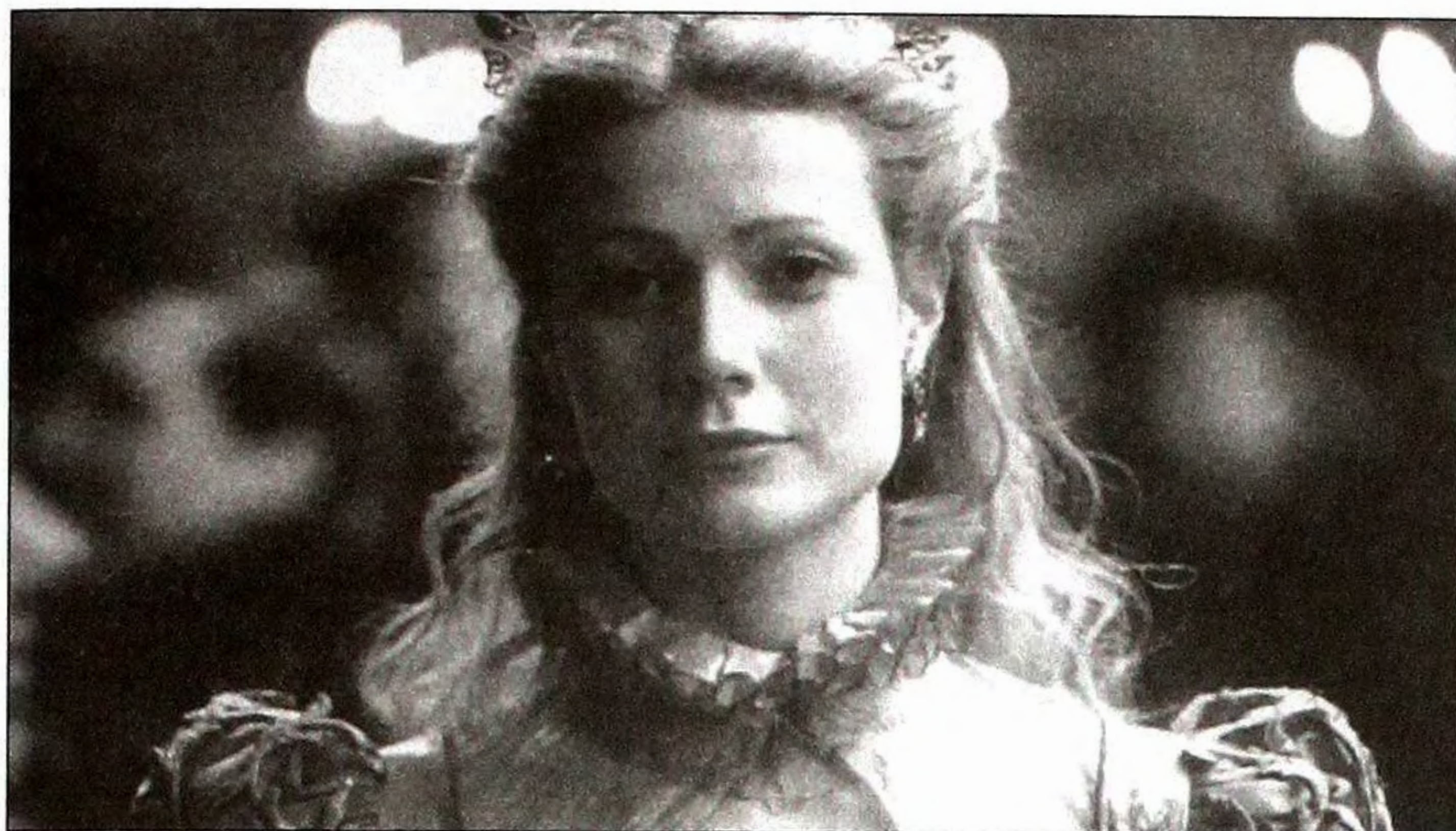
■ Гвінет Пелтроу у фільмі «Закоханий Шекспір».

каже: «Я не маю спеціальної підготовки. Це і добре і погано. Я не відвідувала драматичної студії, отже, я маю все надолужувати в процесі роботи».