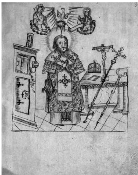
Архиерейське висвячення (ілюстрація з рукопису)