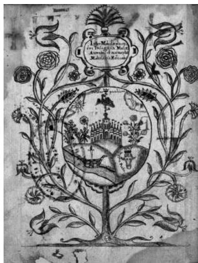
Геральдична композиція, присвячена Петру Могилі