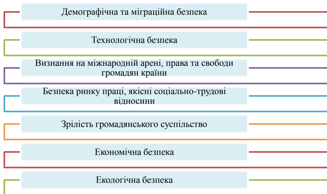
Рис. 4. – Компоненти формування соціальної безпеки країни

На державному рівні соціальну безпеку слід розглядати з позиції безпеки соціальних структур (суспільства) та стійкості й спроможності забезпечити соціально-економічні потреби населення, соціальний захист у разі настання критичних подій. У загальному вигляді соціальну безпеку країни формують різні складові (рис.4) політики уряду, що у сукупності забезпечують реалізацію конституційних прав і свобод, сприяють формуванню потужного потенціалу та умов його реалізації у перспективі.