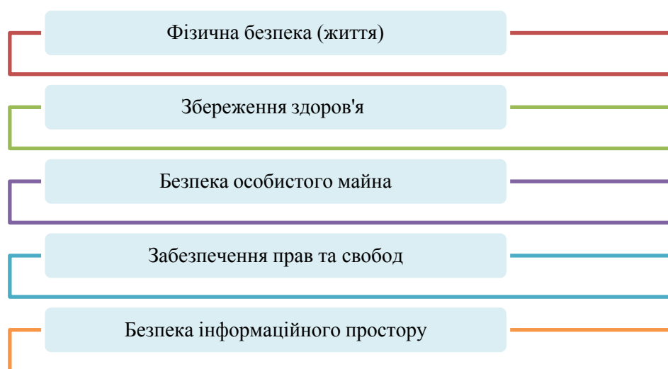
Рис. 1. – Складові соціальної безпеки на індивідуальному рівні

Складові соціальної безпеки на індивідуальному рівні представлені на рис.1: