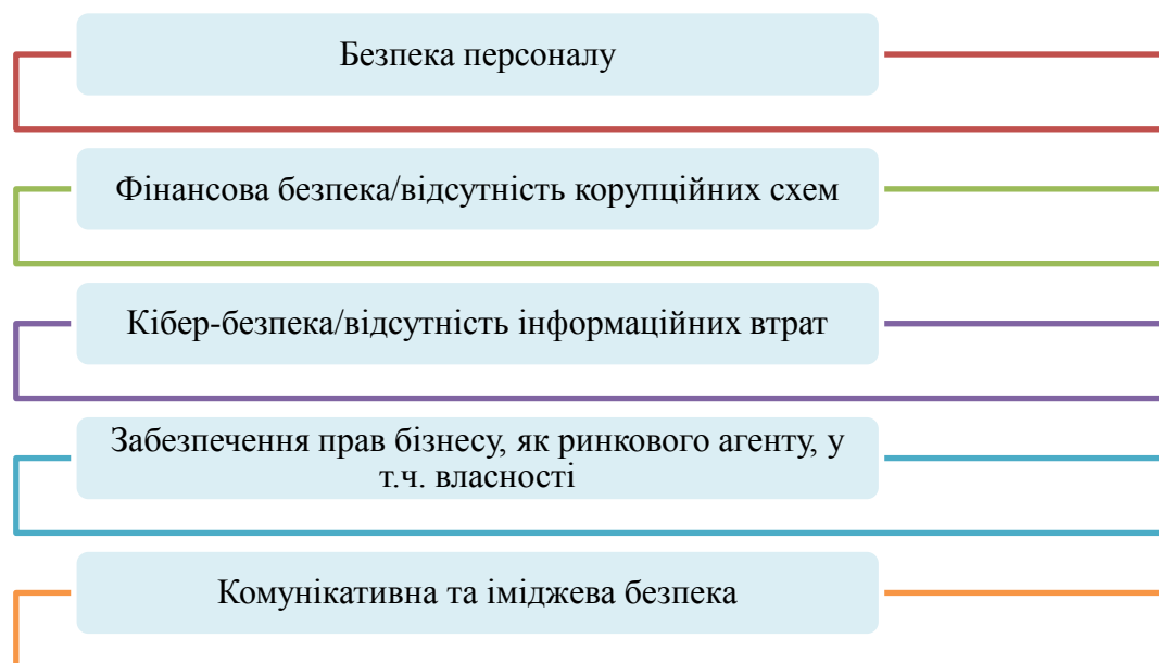
Рис.2. – Компоненти, що формують соціальну безпеку на локальному (організації) рівні