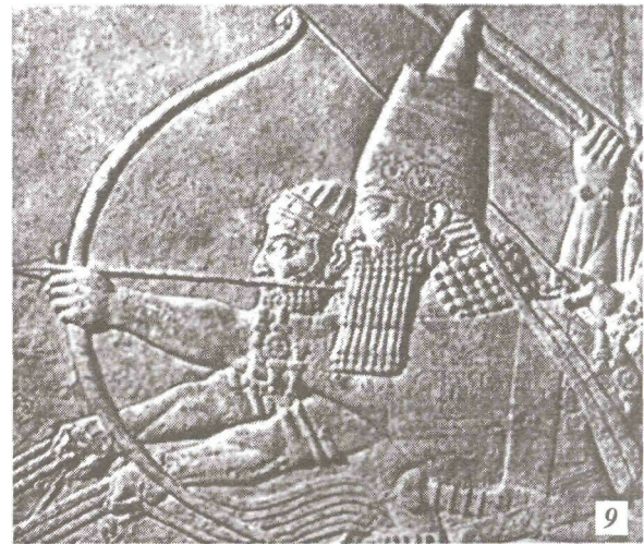
Рис. 2. Способи натягування тятиви (1-5) та зображення луків (6-9): піхви мечів з Мельгунівського та Келермеського курганів (5-7); монета царя Атея (8); (9) фрагмент рельєфа з палацу царя Ашшурбанапала в Ніневії (Лондон, Британський музей)