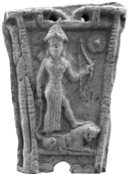
Рис. 1. Теракотова пластина із зображенням Іштар на леві, м. Урук

Іштар як володарка лева зображувалася стоячи на ньому, зокрема на теракотовому рельєфі кінця II тис. до н. е. (рис. 1). Очевидно, образ Матері богів, що спирається ногами на лева, походить саме від неї. Матір представлена сидячи, адже в архаїчний період еллінізована богиня, на зразок інших верховних богів, сідає на трон. Образ божества, що стоїть на леві, і в I тис. до н. е. не покидав Месопотамію. В асирійській Урарті на леві ногами стоїть бог Гальді, який також може зображуватись ногами на коні, кабані або сфінксі [44, S. 941, Taf. CCXVII, CCXIX]. Сирійська богиня стоїть на козлах, обернених у різні боки, або сидить на троні між левами [37, № 170, 173, 176, 186, 189]. Обидві схеми композиції пізніше використовувалися в зображеннях Матері богів і недвозначно вказують на корені іконографії богині.