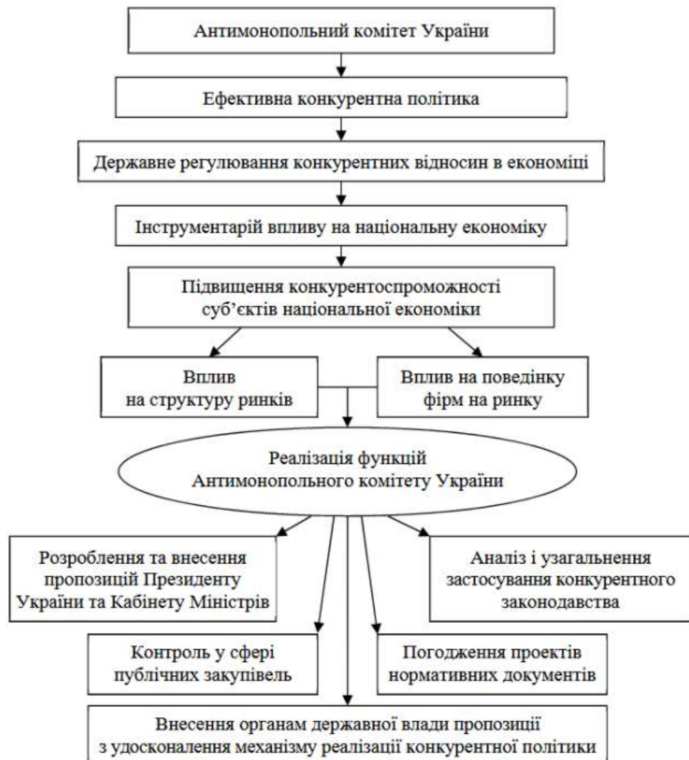
Рис. 3.1. Інституційна спроможність Антимонопольного комітету України МКУ

необхідними інструментами для створення сприятливого конкурентного середовища в Україні (рис. 3.1).