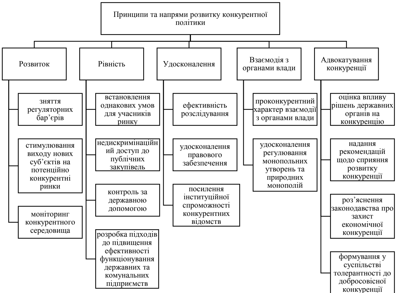
Рис. 1.1. Принципи та напрями розвитку конкурентної політики

конкуренції лежить принцип мінімізації втрат ефективності, які можуть виникнути через відновлення економічних процесів після припинення антиконкурентних дій [17].