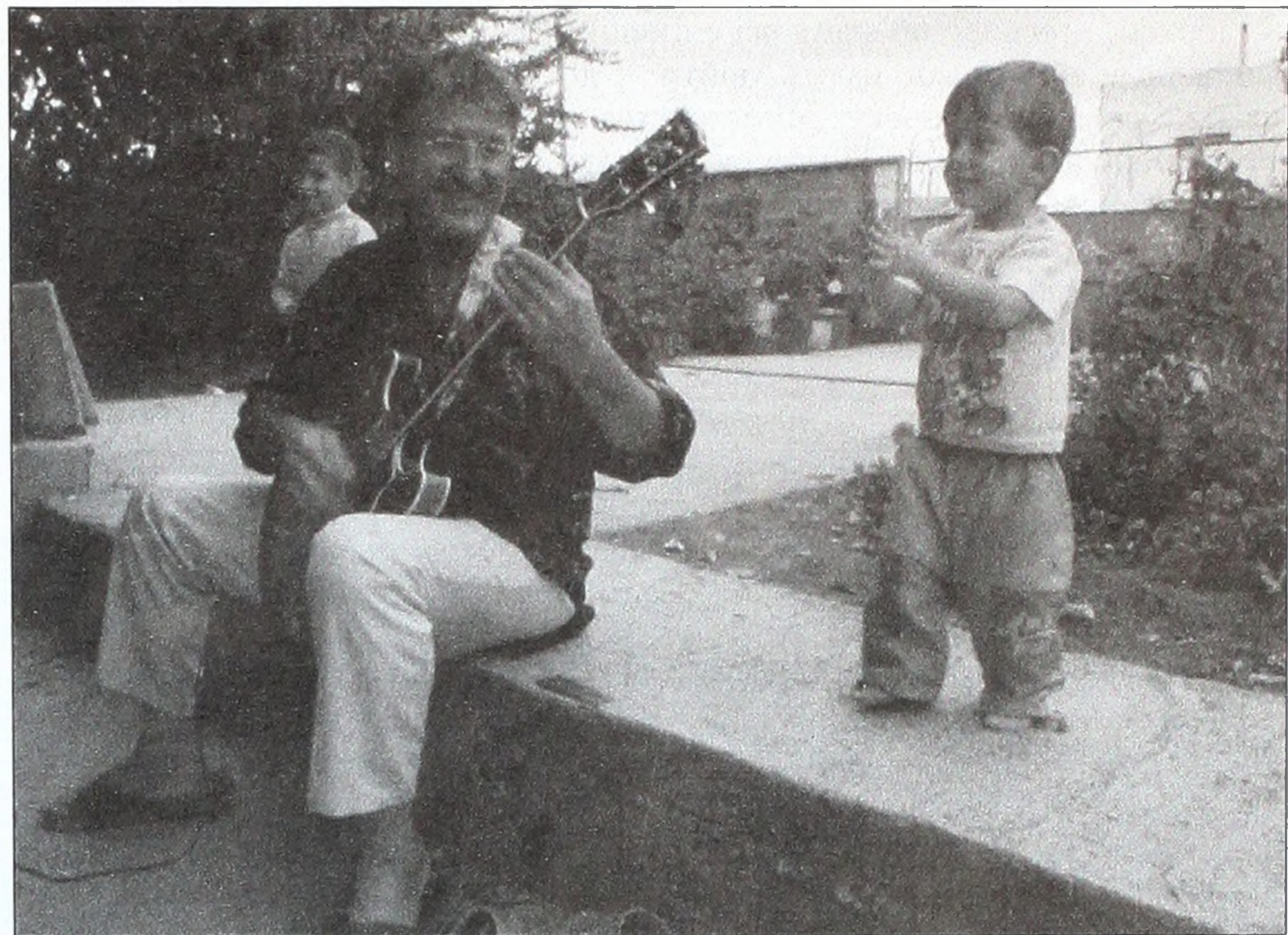
■ Кадр з фільму «З найкращими побажаннями! Енвер».