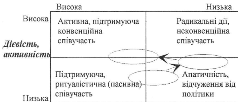
Схема 1. Направленість політичної співучасті.