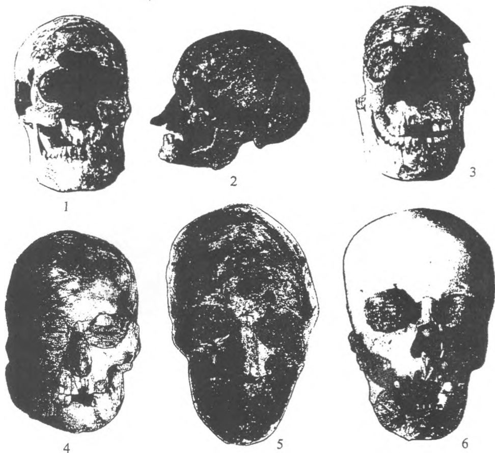
Рис. 3. Моделювання черепів інгульської культури

Єгипетські корені підсилюються тим, що зафіксовані сліди муміфікації. Більш того, в одному похованні виявлено статуєподібну фігуру.