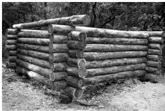
Рис. 5. Спроби відтворення аналогічного слов'янському домобудівництва

Пам'ятка в урочищі «Діброва» («Чернече») біля Ходосівки привертає увагу не лише потенціалом історико-культурної спадщини. Північна експедиція Інституту археології НАН України, що вивчає поселення останнім часом, створила базу експериментальної археології, де моделюються давні споруди, процеси і технології за прототипами, виявленими під час розкопок. Проведено дослідження в галузі лісохімічних промислів (випалювання деревного вугілля, добування смоли та дьогтю корчажним способом, ямне смолокуріння), чорнометалургійного виробництва (реконструкція горен та загалом сиродутного процесу), керамічного виробництва (спорудження ножного гончарного круга і горен, виготовлення і випал посуду), бортництва, розпочато натурне реконструювання слов'янського домобудівництва (рис. 3–6) [27; 29; 31; 32]. Отримані успішні результати мають не лише академічне значення. В сучасних наукових працях пи-