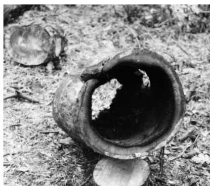
Рис. 6. Заготовка борти на експедиційному майданчику натурних реконструкцій

тання створення археологічних парків, скансенів, археодромів та експериментальних поселень відносять до найактуальніших серед нових підходів до тематико-експозиційних комплексів [41]. Фахівці зазначали, що «моделювання історії та культури давнього населення України музейними засобами вимагає розробки нових типів музеїв. ...Постає потреба створення інтер'єрних тематико-експозиційних комплексів, за основу яких буде взято реконструйоване житло. Давні споруди доцільно демонструвати в археопарках, у так званих археологічних скансенах-діснейлендах та археологічних діснейлендах (відтворених об'єктах в археодромах, на експериментальних поселеннях). Демонстрація в археологічних скансенах передбачає музеєфікацію відкритих споруд, тобто проведення археологічних... досліджень. Щодо археологічних діснейлендів, то їх доцільно влаштовувати в місцях концентрації пам'яток археології, які неможливо зберегти in situ, але природний ландшафт місцевості дозволяє оголосити їх території геолого-археологічними чи природно-археологічними заповідниками» [81, с. 49, 50]. Охарактеризована концентрація пам'яток біля Ходосівки, а також близькість до столиці та популярність мікрорегіону як зони масового відпочинку дає унікальну