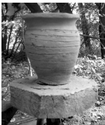
Рис. 4. Виготовлення керамічного посуду

Пам'ятка в урочищі «Діброва» («Чернече») біля Ходосівки привертає увагу не лише потенціалом історико-культурної спадщини. Північна експедиція Інституту археології НАН України, що вивчає поселення останнім часом, створила базу експериментальної археології, де моделюються давні споруди, процеси і технології за прототипами, виявленими під час розкопок. Проведено дослідження в галузі лісохімічних промислів (випалювання деревного вугілля, добування смоли та дьогтю корчажним способом, ямне смолокуріння), чорнометалургійного виробництва (реконструкція горен та загалом сиродутного процесу), керамічного виробництва (спорудження ножного гончарного круга і горен, виготовлення і випал посуду), бортництва, розпочато натурне реконструювання слов'янського домобудівництва (рис. 3–6) [27; 29; 31; 32]. Отримані успішні результати мають не лише академічне значення. В сучасних наукових працях пи-