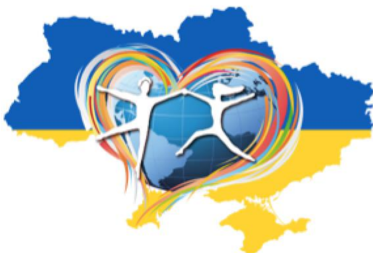
Рис. №4 –символіка жіночої організації «Жіночий інформаційно-консультативний центр»