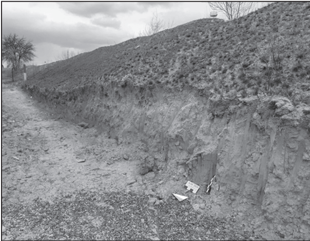
Рис. 10. Карта-схема розташування зруйнованої ділянки валу та острогу на пам'ятці археології у с. Білгородка; Фото зруйнованої ділянки валу

З метою встановлення можливого зв'язку переданого до НМІУ скарбу з іншими археологічними пам'ятками, на прилеглій території було проведено археологічні розвідки, в результаті яких з'ясувалося, що скарб був захований на території не відомого раніше поселення черняхівської культури, загальна площа якого становить близько 50 га. Пам'ятка отримала шифр «Синиця 1». За знайденими на поверхні матеріалами вона може датуватися IV – початком V ст. Серед