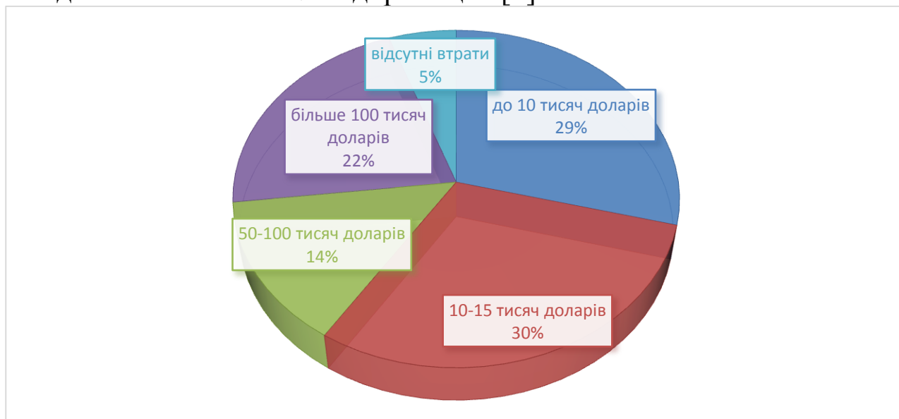
Рис.1 – Втрати МСБ на початок осені 2022 року

10-50 тисяч, ще 13% – в діапазоні 50-100 тисяч, а 20% – більше 100 тисяч, що в півтори рази більше, ніж у травні. Про відсутність втрат повідомляють тільки 5% підприємців. [1]