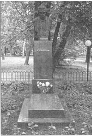
Могила О.О. Богомольця

ну, металургійну й харчову промисловість, промисловість будівельних матеріалів, сільське господарство та житлово-комунальне господарство [15]. Було визначено проблематику науково-дослідницьких робіт, пов'язаних зі швидкісною відбудовою Донбасу, соляної промисловості України, виробництвом гіпсу, магнезійного цементу та ін. [16]. 26 вересня 1944 р. широко відзначалося 25-річчя заснування найвищої наукової установи України. Загальні збори Академії проходили в Державному оперному театрі ім. Т.Г. Шевченка у Києві [11, с. 76]. Було проведено дострокові вибори членів Академії. Президія прийняла рішення про утворення нового відділу — сільськогосподарських наук. Структурні зміни, що відбулися в АН України в останні роки, було затверджено в новому Статуті [17—19].