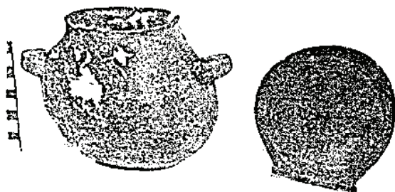
Рис. 2. Дворучна чаша і кришка з кургану Осипова могила

Поряд зі згаданим посудом стояла округла дворучна посудина. Тривалий час дослідники цей тип дерев'яних артефактів називали по-різному: мискою, кубком, вазою [8]. Доречнішу назву запропонувала В. О. Рябова [9], а саме – дворучна чаша. Вона мала округлу форму з ледь піднятими вінцями. Ручки закріплені дещо піднято догори. Чашу було видовбано з наросту (капу) на дереві, на що вказує нижня деформована частина. Вона мала кришку також дерев'яну, до того ж із внутрішнього боку кришки було вирізане коло, що мало «сідати» на вінчик посудини. Ймовірно, кришка кріпилася до корпусу посудини за допомогою шарнірної конструкції (рис. 2).