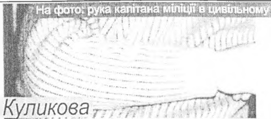
На фото: рука капітана міліції в цивільному