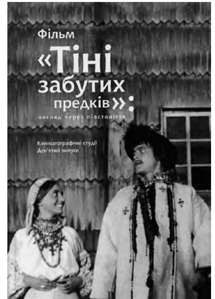
Фільм "Тіні забутих предків": погляд через півстоліття. 36. статей і документів. К.: Редакція журналу "Кіно-Театр", Видавничий дім "Києво-Могилянська академія", 2018. 252 с., іл.