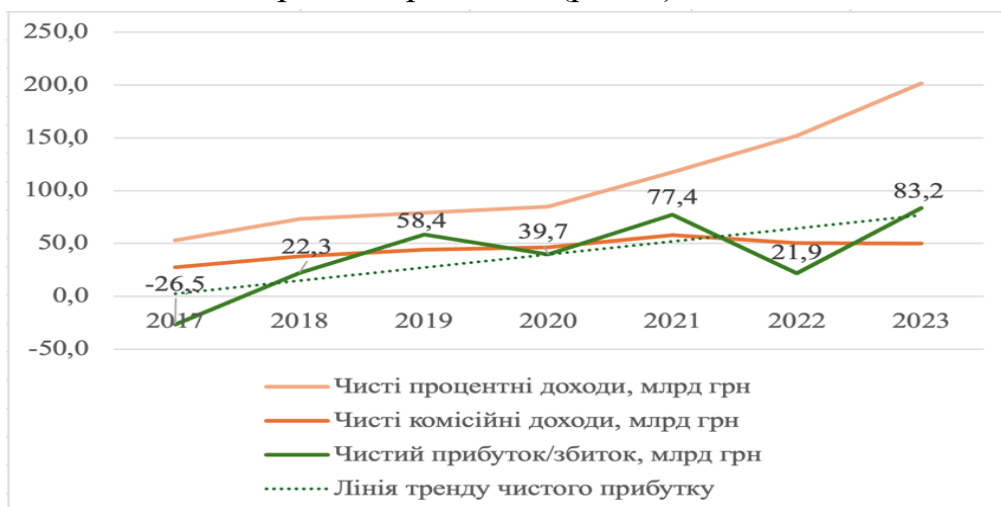
Рис. 1 Фінансові результати банківського сектору України

Незважаючи на негативний вплив війни на банківський сектор, фінансові результати банків свідчать про його розвиток (рис. 1).