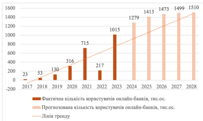
Рис. 3 Кількість користувачів онлайн-банків в Україні за роками, тис. ос. Джерело: [7]

Одним з наслідком цього стало посилення тенденції цифровізації банківських послуг. Зокрема, популярності в Україні набуває онлайн-банкінг, або ж необанкінг, тобто банки без відділень. Так, незважаючи на падіння показників банківського сектору після початку війни, вже у 2023 році кількість користувачів таких банків збільшилась на 42% порівняно з 2021 роком, а у 2028 році за прогнозом має перевищити позначку у 1,5 млн осіб (рис 3).