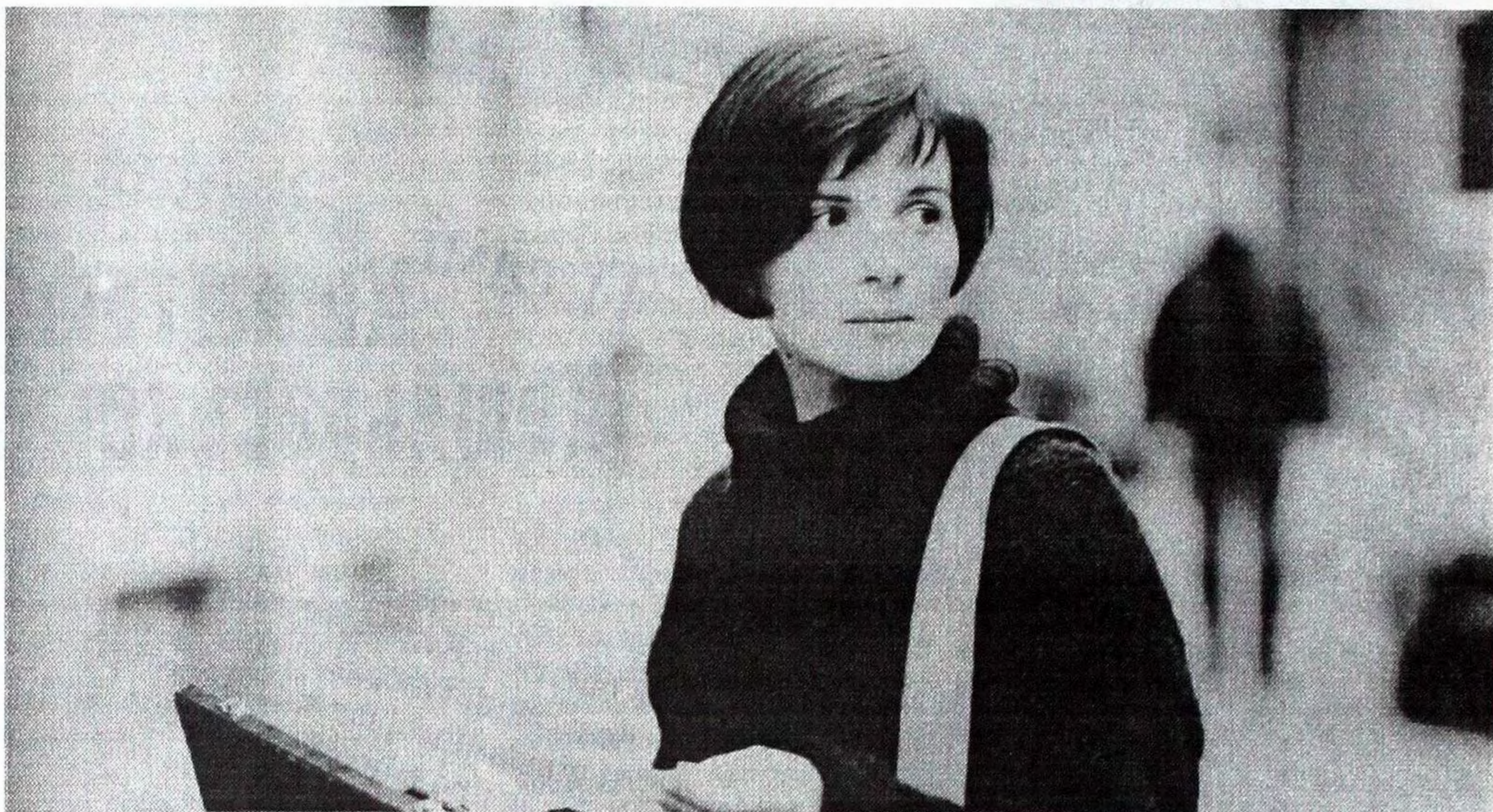
Джульєт Біноф у фільмі "Три кольори. Синій".

справді порушуються такі питання, на які немає відповіді. І вони не розлучаються з вами від дитинства до смерті.