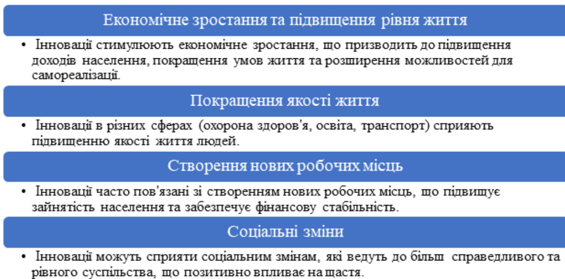
Рис. 1. Вплив інновації на рівень щастя в суспільстві

Відобразимо тепер зворотній взаємозв'язок, зокрема, як рівень щастя здатне впливати на інновації (див. рис. 2).