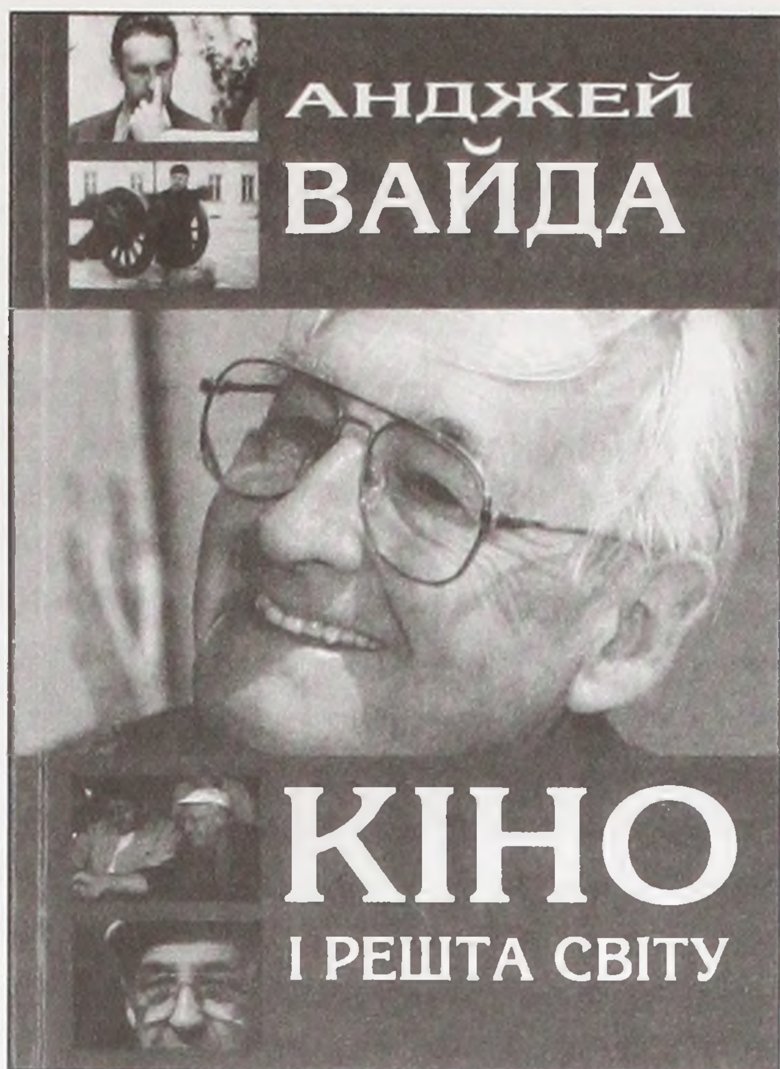
«КІНО І РЕШТА СВІТУ» Анджей Вайда Київ: «Етнос», 2004.