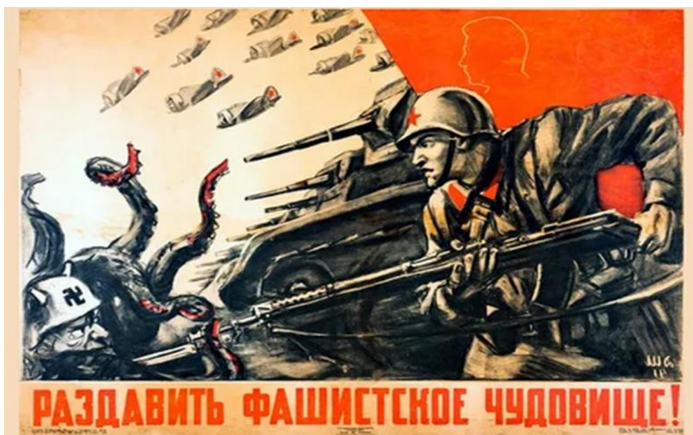
Рис. 3 «Роздавити фашистське чудовисько»