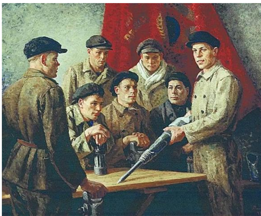
Рис. 2 Георгій Рязжський «Перед зміною, Бригада Стаханова», 1937 р.