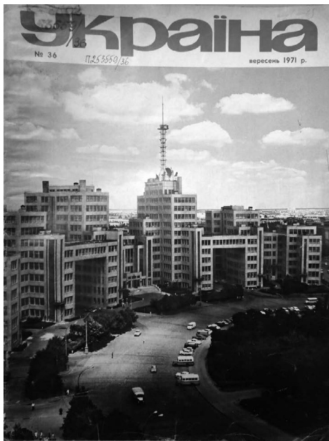
Один із головних архітектурних символів Харкова – Держпром – на обкладинці журналу «Україна» (№ 36, вересень 1971).

Серед популярних у містян монументальних місць пам'яті, присвячених «Великій Жовтневій соціалістичній революції» як центральному елементу радянської міфології, слід назвати Пам'ятник борцям Жовтневої революції, встановлений у листопаді 1957 р. (з нагоди 40-річчя Комуністичної партії України в 1958 р. біля підніжжя пам'ятника було запалено вогонь Вічної слави), а також Монумент на честь проголошення Радянської влади в Україні, встановлений у листопаді 1975 р. Обидва пам'ятники стали невід'ємними складниками культурно-символічного простору радянського міста «робітничої слави».