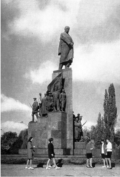
Пам'ятник Тарасові Шевченку (поштова видова листівка, 1970 р.).

Харківський міськком комсомолу та експериментальний центр молодіжного дозвілля 16 .