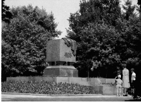
Монумент на честь проголошення Радянської влади в Україні. Пам'ятник борцям Жовтневої революції (видова листівка, 1985 р.).

Не випадково наприкінці 1980-х рр. саме ці монументальні місця пам'яті стали традиційним місцем маніфестацій для прихильників комуністичного режиму.