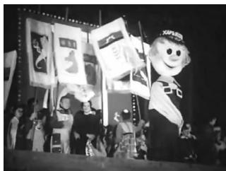
Кадри документального фільму «День відкритих сердець» (1988 р.), присвяченого святкуванню першого Дня міста в Харкові.