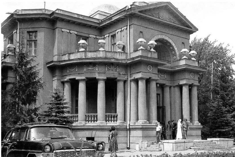
Палац одруження в Харкові (поштова видова листівка, 1985 р.).

слугувати свято «Ми – харків'яни!», що відбулося в одному з нових житлових масивів Харкова у вересні 1978 р. 31