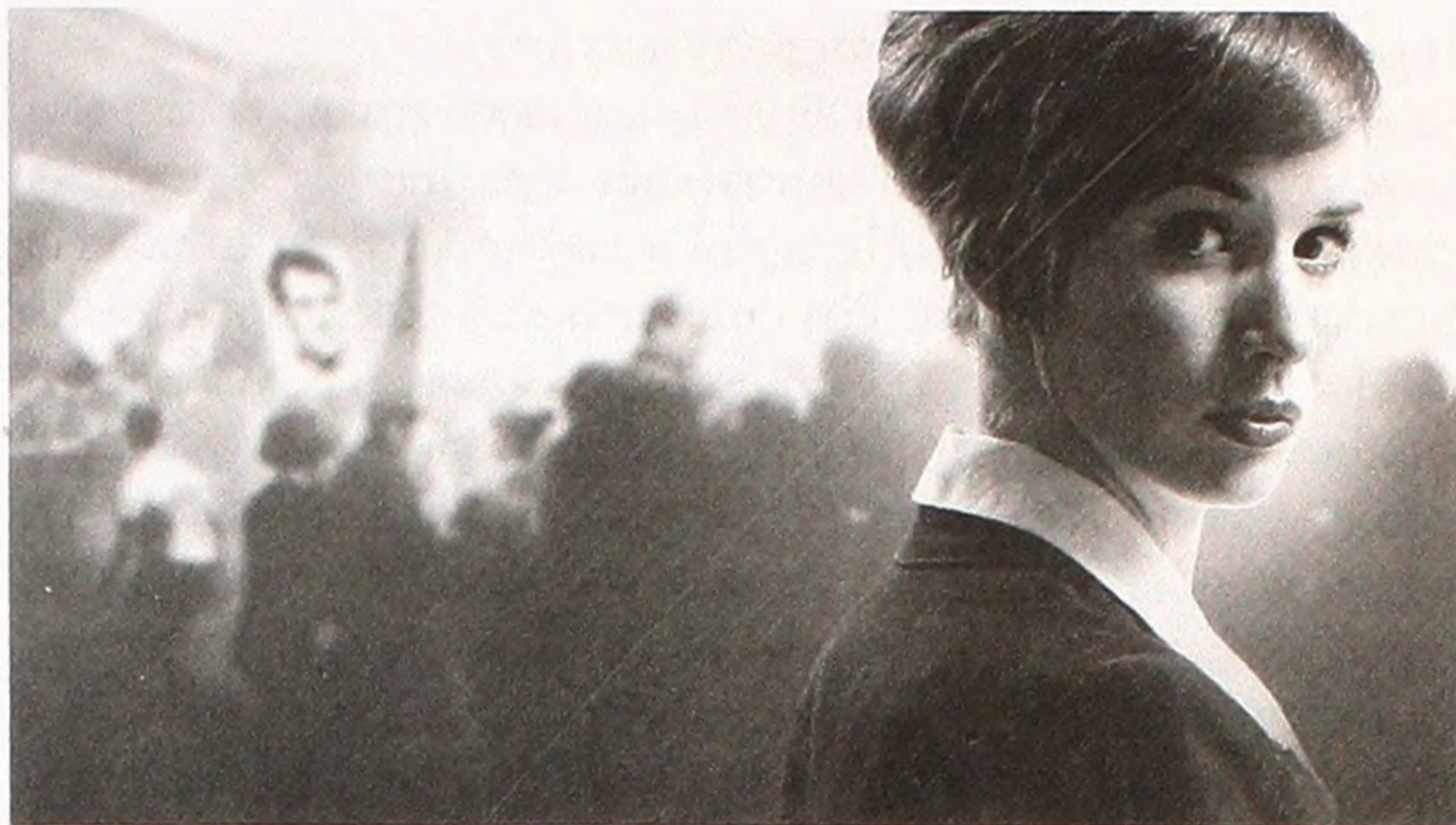
Промо-фото до телефільму «Неопалима купина».