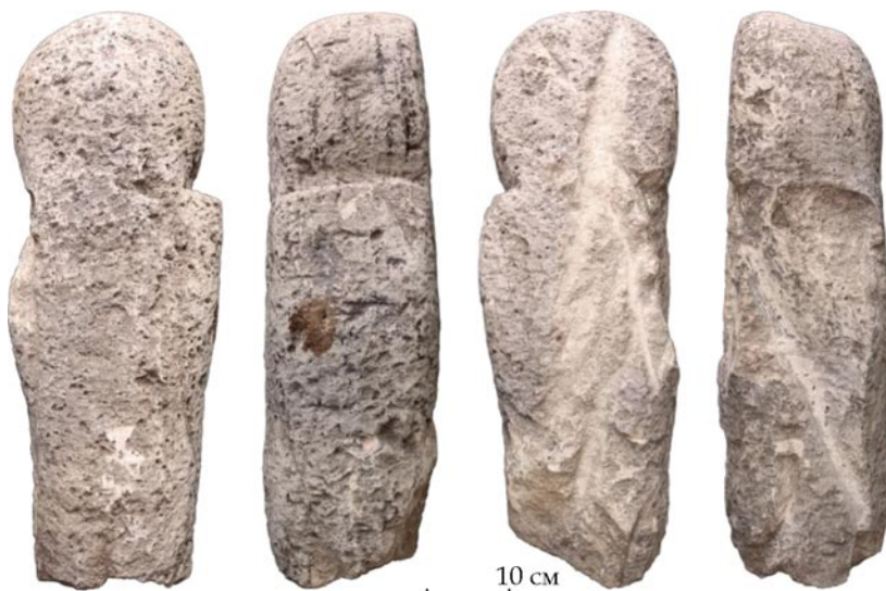
Рис. 1. Силуетна стела Білоцерківського краєзнавчого музею