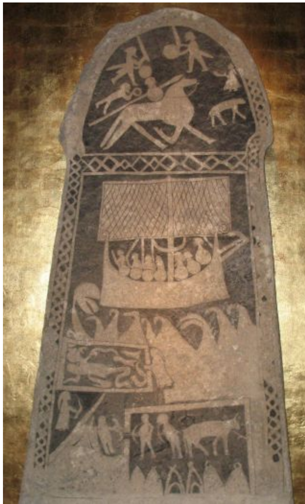
Готландська поминальна стела з Гуннінге (повіт Клінте), 8 ст. Традиційно трактують як сцени з епосу про Сіґурда, інша версія — сюжет про посмертну подорож, де Вальгалла — згори, повсякдення Гель — долу

Гель, Хель (Гелла; давньосканд. hel ) — назва краю померлих у міфології вікінгів (ширше — у стародавніх германців) та ім'я володарки цього краю. Фразеологізм «Рушив до краю Гель» (Гельгейму) прочитують і як топонім, і як вказівку на приналежність («чий край»). Край Гель вважали одним із міфічних Дев'яти світів. У зрілих віруваннях доби вікінгів протиставлений Вальгаллі.