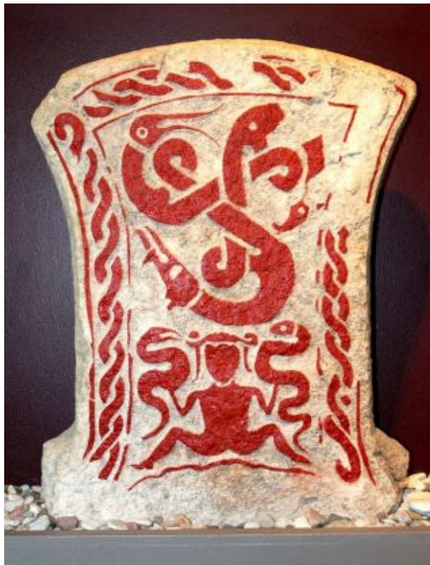
Готландська поминальна стела 5-7 ст., також відома як «Змієвідьма»

Принципове «вертикальне» розведення «небесної» та «благої» Вальгалли супроти «підземного» та «ганебного» краю Гель вважають пізнім явищем у свідомості скандинавів, що відбувся, ймовірно, під впливом християнства. Існує думка, що імлісті прохолодні краї Гель первинно вважали «нормативним» посмертям для всіх давніх германців, де померлі продовжували свої звичні прижиттєві справи. Хоча потойбіччя уявляли «світом навиворіт»: місяць замість сонця, гірке замість солодкого тощо. Водночас обидві згадані локації — Вальгалла (місце для обраних воїнів та звитяжців) і Берг Мерців (для приречених злочинців і проклятих) — були полярними територіями неосяжних просторів краю смерті, що призначені для «нестандартного» посмертя.