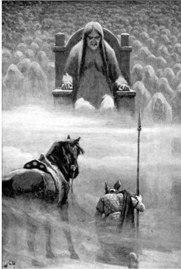
Гермод перед Гель. Художник Дж. Ч. Доллман, ілюстрація з книги Guerber H. A. Myths of the Norsemen from the Eddas and Sagas. London : Harrap, 1909. P. 210.