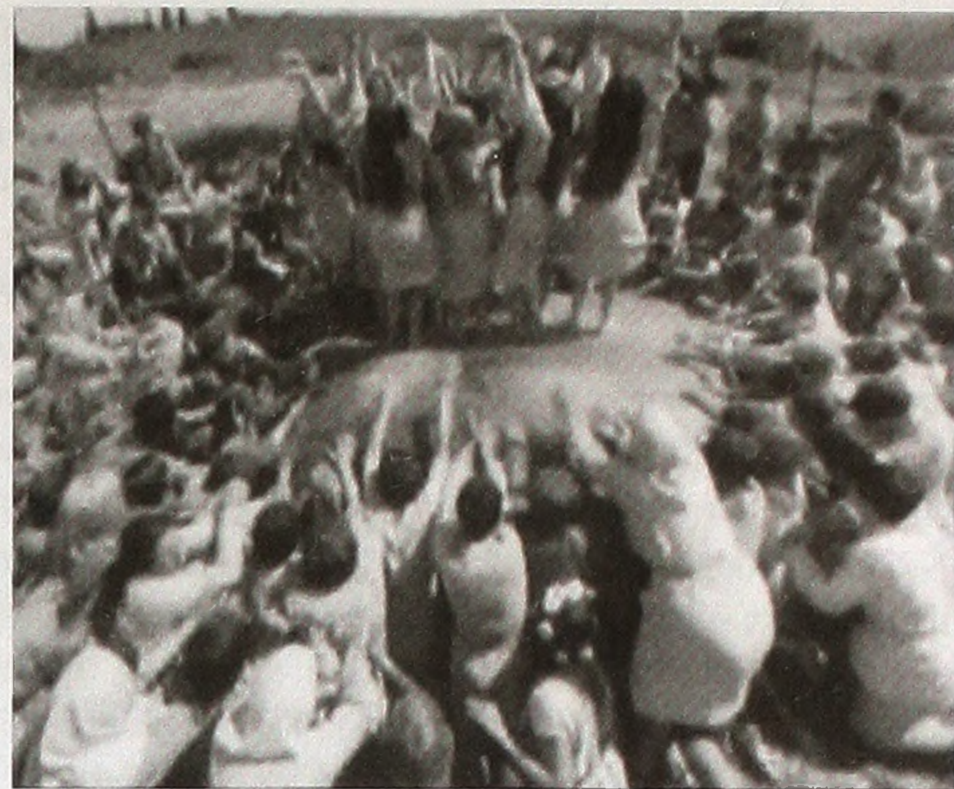
Кадр з фільму «Третя після Сонця». За твором П. Вежинова. Режисер Георгій Стоянов. Болгарія, 1972

Фантастичну трилогію «Третя після сонця» Георгій Стоянов знімає в час зацікавлення наукою, технічним прогресом і дослідженням космосу. Саме ця проблематика лягає в основу стрічки, зокрема головної її частини – «Мій перший день». Режисер створює філософсько-метафоричний фільм про людство, його еволюцію, про життя первісне і високоцивілізоване. В час захоплення технічними можливостями, безмежжям неосвоєного космічного простору Георгій Стоянов повертається до людини, до людства передовсім як поняття духовно-культурного. Жанрова специфіка стрічки допомагає задуму режисера, висвітлюючи