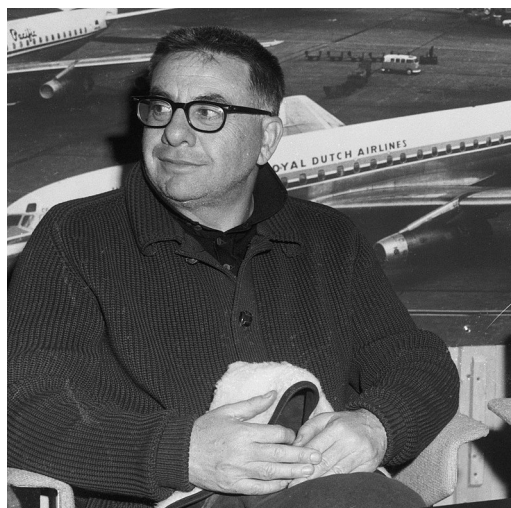
Режисер Мартін Рітт.

За всієї спорідненості мистецького світу Кіри Муратової з Одесою, він парадоксальним чином виходить далеко за межі сенсів і образів одного міста і являє універсальність авторських меседжів, відкритих до прочитання в різних світових культурах. Ця властивість муратівської кіномови принесла їй низку призивів на міжнародних кінофестивалях, включно із Венеційським, Берлінським, Локкарнським та ін. Від кінця 1980-х і до наших днів за рівнем світового визнання Кіра Муратова незмінно входить до еліти української кінорежисури і лишається першою леді жіночої режисури України.