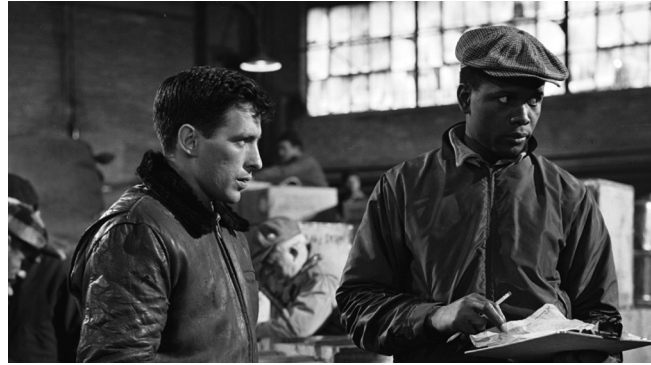
Джон Кассаветіс та Сідні Пуаатьє у фільмі «На околиці міста». Режисер Мартін Рітт. США, 1957.

«Хад» (1963) – перший фільм Рітта, удостоєний одразу кількох нагород, у т. ч. Венеційського кінофестивалю, ВАФТА, Національної ради кінокритиків США і трьох премій «Оскар»: найкращій акторці (Патріція Ніл), актору другого плану (Мелвін Дуглас), за операторську роботу