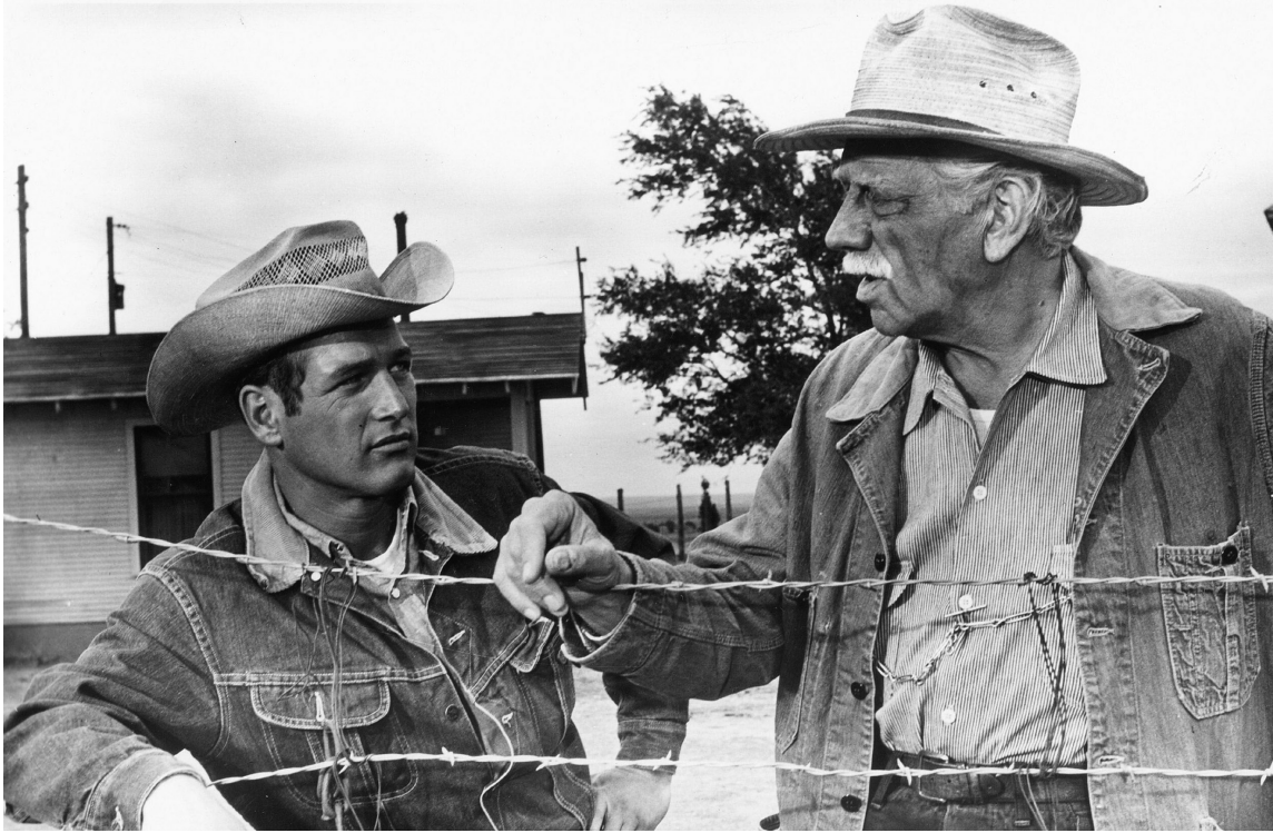
Пол Ньюман та Мелвін Дуглас у фільмі «Хад». Режисер Мартін Рітт. США, 1963.

ника на телебаченні. Але цей етап завершився внаслідок політичних репресій щодо лівих діячів у США – Рітт став жертвою маккартівської антикомуністичної кампанії і в 1951 році потрапив до чорного списку телевізійної індустрії, тож знову повернувся у театр.