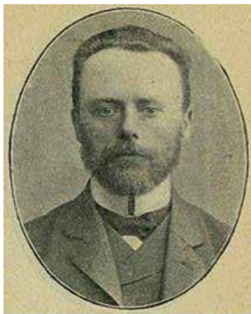
Рис. 130. Андрій В'язлов (1862–1919 рр.).

Ради об'єднаних громадських організацій де-факто стали найвищими органами влади до виборів літа 1917 р. Крім того, Тимчасовий уряд, як центральний орган державної влади в Росії після Лютневої революції, призначає на Волинь свого повноважного представника, який мав права та функції колишнього імперського губернатора – губернського комісара Андрія В'язлова (1862–1919 рр.). Уродженець Волині А. В'язлов до призначення на посаду волинського губернського комісара Тимчасового уряду вів юридичну практику, його обирали депутатом Державної думи першого скликання, 1915 р. був призначений уповноваженим Всеросійського союзу міст Південно-Західного фронту, де займався організацією санітарної справи, допомогою біженцям. Пізніше працював міністром юстиції в Українській Державі Гетьмана Павла Скоропадського, а 1919 р. очолив головну управу Українського товариства Червоного Хреста 112 (рис. 130).