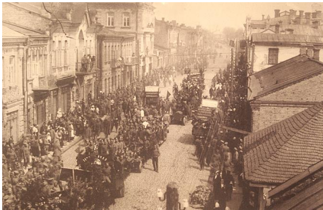
Рис. 128. Демонстрація 1 травня 1917 р. на головній вулиці Луцька

Революція 1917 р. в Росії мала доленосні наслідки і на загальносвітовому рівні, і в регіональному вимірі. Динамічний розвиток подій, який був започаткований зреченням Миколи II, сприяв зростанню національного руху на території колишньої імперії. Ці тенденції простежувались і в українських губерніях, зокрема на теренах прикордонного Волинського краю (рис. 128, 129).