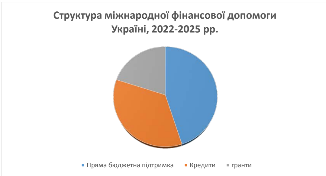
Рис.1. Джерела міжнародної фінансової допомоги [4,5]