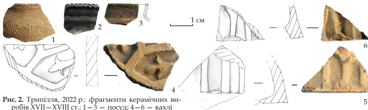
Рис. 2. Трипілля, 2022 р.: фрагменти керамічних виробів XVII–XVIII ст.: 1–3 – посуд; 4–6 – кахлі