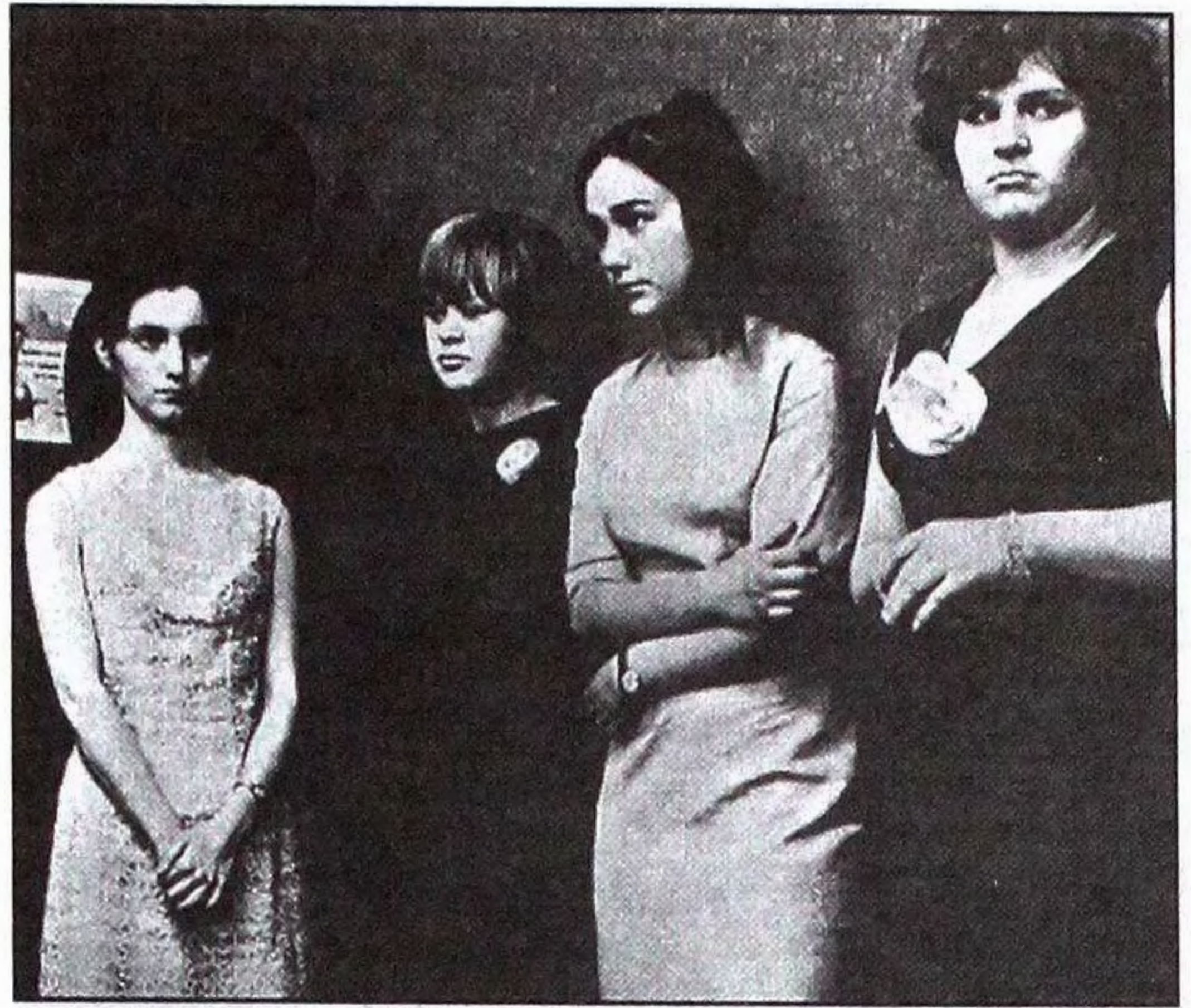
Кадр із фільму "Горимо, моя панно". Режисер М.Форман. 1967.

Фільм є результатом уважного спостереження над так званім молодіжним рухом кінця шістдесятих. Представляв проблеми батьків і дітей. Його можна схарактеризувати як американську комедію в чеській стилі. Режисер показав батьків, типові американські ідеальні пари щасливих людей із щасливими проблемами. У фільмі є багато гумору, експресії молодих, досконалі характеристики дорослих. Здатність спостереження Формана тут