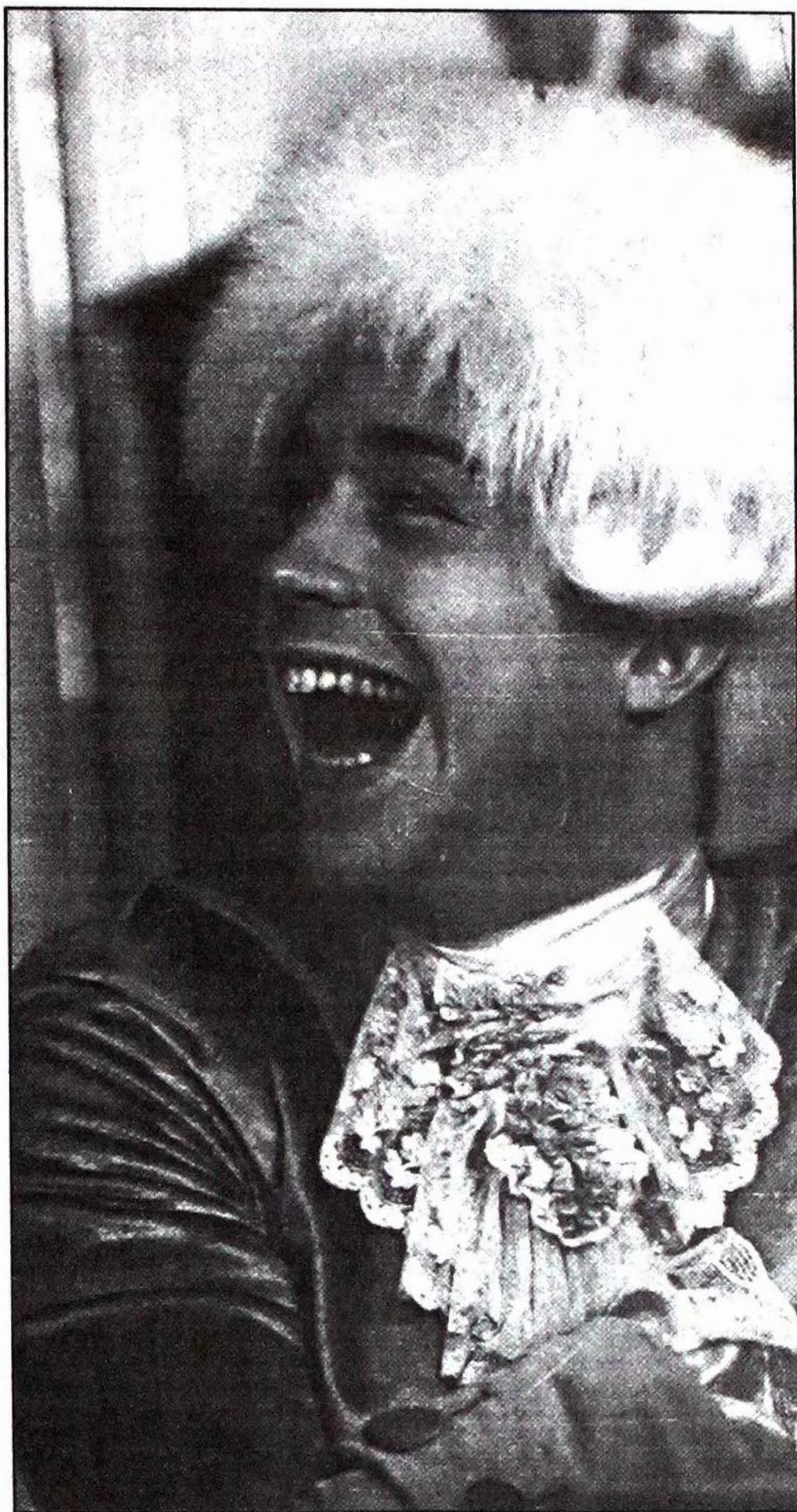
Кадр із фільму "Амадеус". Режисер М.Форман. 1984.

Фільм показано на завершення кінофестивалю у Карлових Варах у липні 1990 року. Олександр Ледоховський написав про нього у своїй фестивальной кореспонденції: "Цей фільм здався прекрасною нереальною з'явою. Ніби квіткою з іншого городу, чимось поза сучасністю, а власне позачасовим, чимось, що є виразом радості творчості" (Film, 1990, №31). Вважав, що фільм є класичним за формою і способом мислення. І далі - що