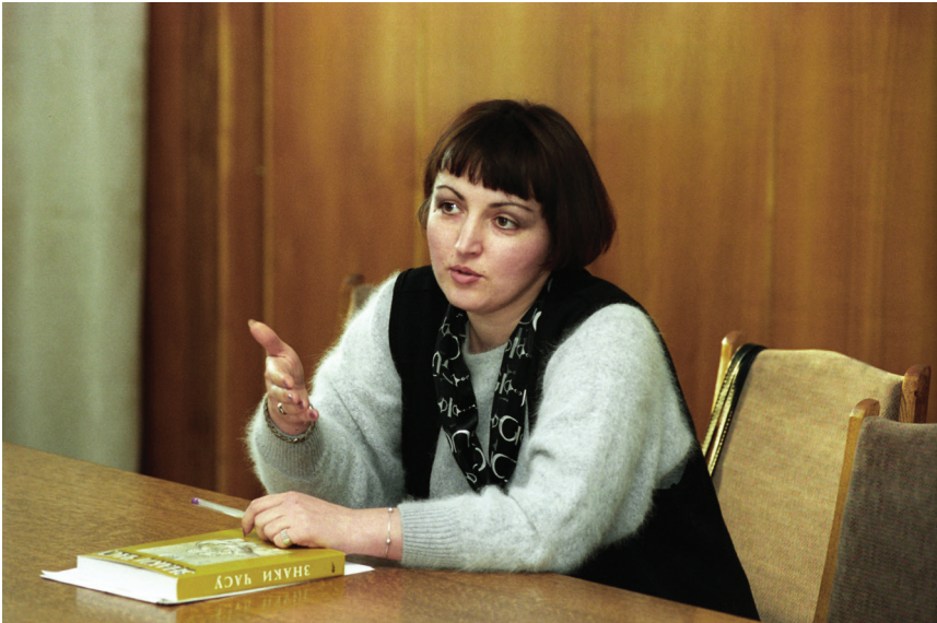
На презентації збірника «Знаки часу: До проблеми порозуміння між церквами» (Київ: Сфера, 1999). НаУКМА, 2000 р.