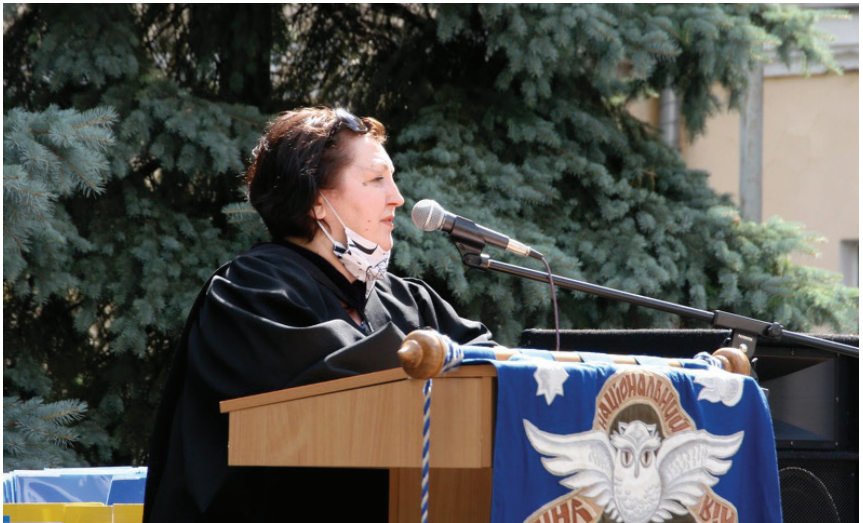
На Посвяті у студенти НаУКМА, 2021 р.