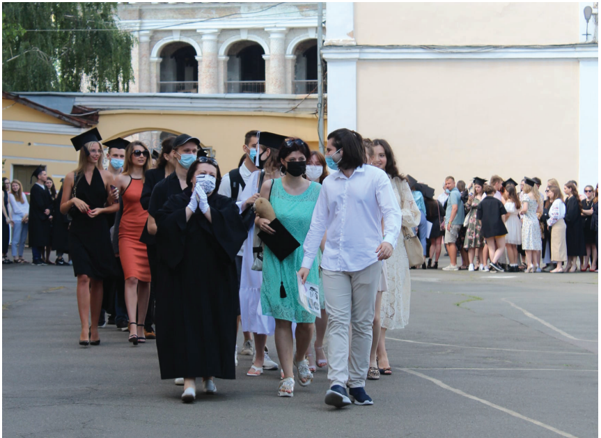
Зі студентами факультету гуманітарних наук. Конвокація, 2021 р.