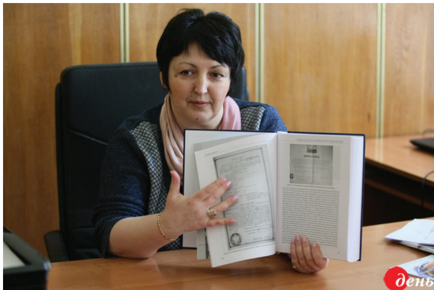
Під час інтерв'ю газеті «День». НАУКМА, 2017 р.