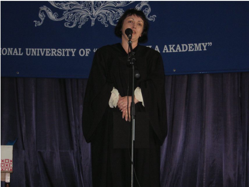
Вітальне слово випускникам факультету гуманітарних наук. НаУКМА, 2008 р.

зокрема професорів та вихованців Київської духовної академії та Університету Св. Володимира, вона акцентує увагу на людському вимірі історії філософії, повертає до актуального складу культури забуті постаті та ідеї, органічно залучені до загальноєвропейських інтелектуальних процесів, а отже, позбавляє українську гуманітарну академічну традицію відчуття духовного «сирітства», сповнює ідею спадковості інтелектуальних поколінь реальним змістом.