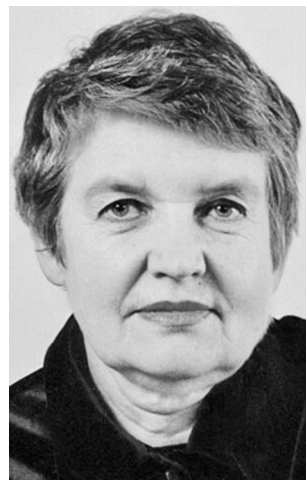
Режисерка анімаційного кіно, викладачка Валентина Костилюєва.

Валентина Костилюєва (н. 1947) – українська режисерка анімаційного кіно, режисерка телебачення, викладачка. Закінчила режисуру на кінофакультеті КДІТМ ім. І. Карпенка-Карого. З 1970 працювала у Творчому об'єднанні художньої мультиплікації студії «Київнаукфільм». Поставила фільми: «Вася та динозавр» (1971), «Ниточка і Кошеня» (1974), «Казки про машини» (1975), «Тато, мама і золота рибка» (1976), «Хто в лісі хазяїн» (1977), «Свара» (1978), «Кольорове молоко» (1979), «Пригода на дачі» (1980), «Кирпатий майстер» (1981), «День везіння», «Дуже давня казка» (обидва – 1982), «Казка про карасів, зайця і бублики» (1984), «Любчику-любчику» (1985), «Про бегемота на ім'я Ну-й-Нехай» (1986), «Велика подорож» (1987), «Із життя олівців» (1988), «Стародавня балада» (1989), «Мотузочка», «Найсправжнісінька пригода», «Кам'яні історії» (всі три – 1991), «Приз» (1992), «Цап та баран» (1993), «Тополя» (1995), «Ходить гарбуз по городу» (1996).